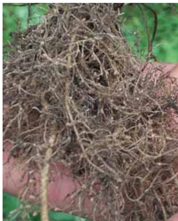
Le trèfle a la capacité de fixer l'azote

Le principal effort que l'éleveur doit fournir se situe au niveau des soins, des connaissances et du savoir-faire, ce qui peut représenter un important défi pour les éleveurs actuels.