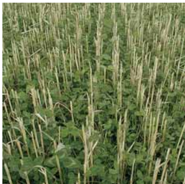
Sous-ensemencement du trèfle

L'efficacité de la digestion peut être améliorée avec des espèces très digestes, mais à condition qu'il y ait assez de structure dans le fourrage. Cette structure doit provenir de préférence d'une source de cellulose comme la luzerne, le trèfle violet ou le foin. L'herbe de prairie et l'herbe d'une zone naturelle sont idéales. Ces fourrages sont indispensables pendant la période de tarissement, étant donné la