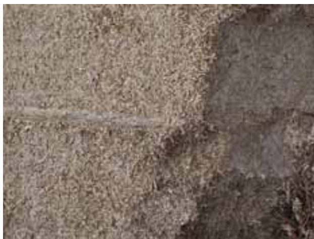
Gros plan de cigarant, une alternative valable à la pulpe de betterave

La force des betteraves réside dans leur faible teneur en protéines et leur teneur élevée en MOF*, provenant surtout des pectines* de la pulpe de betterave (hydrates de carbone de la paroi cellulaire) et des sucres des betteraves fourragères (hydrates de carbone du contenu de la cellule).