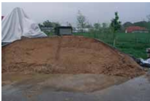
Dans une certaine mesure, le soja peut être remplacé par de la drêche

Une autre option consiste à remplacer le soja par de la drêche ou des tourteaux de lin , ce qui n'est possible que dans une certaine mesure. En effet, la vitesse de la digestion de l'énergie se réduit avec les rations riches en maïs, ce qui entraîne des problèmes de productivité. Lorsque les tourteaux de soja sont remplacés par d'autres fourrages, la ration risque d'être déséquilibrée en raison des caractéristiques de ces alternatives.