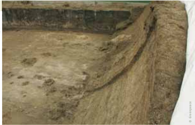
Ensilage de trèfles