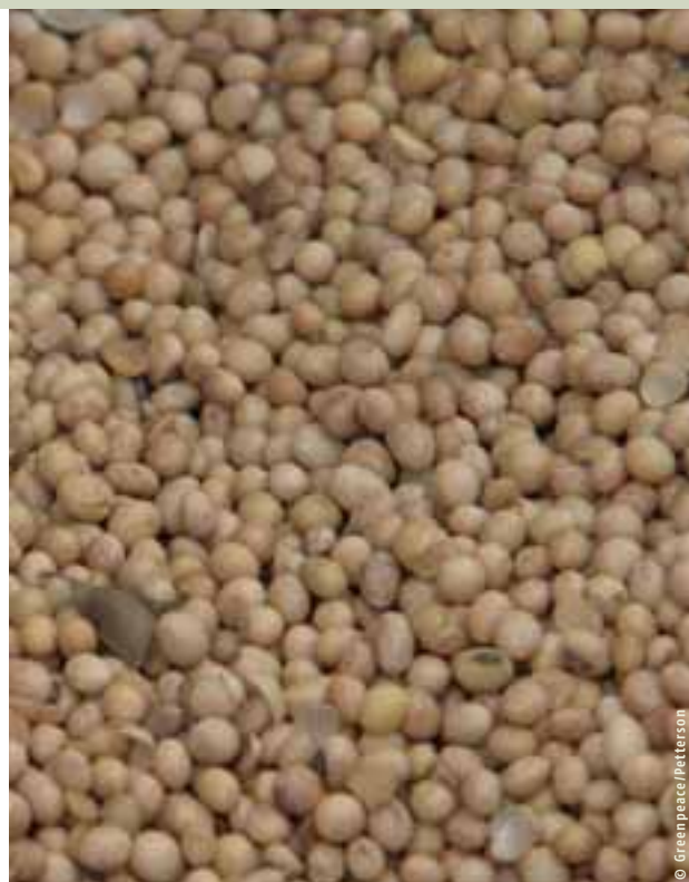
Fèves de soja. Le soja est aujourd'hui un ingrédient de base dans la ration du bétail laitier

Comme nous l'avons exposé plus haut, la dépendance au maïs et au soja dans l'élevage laitier européen a connu une croissance historique. Le maïs semble en première