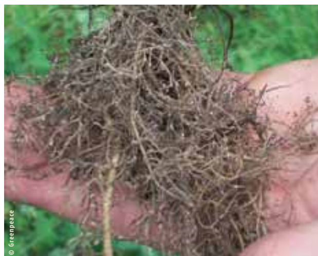
Le trèfle a la capacité de fixer l'azote

Ce plan de culture permet de produire efficacement du lait à coût réduit et, moyennant une attention nécessaire pour l'équilibre des rations, avec des effets réduits de l'azote sur l'environnement. Enfin, cette stratégie développée, qui évite tout recours aux ingrédients OGM, offre une plus-value intéressante pour l'ensemble de la société.