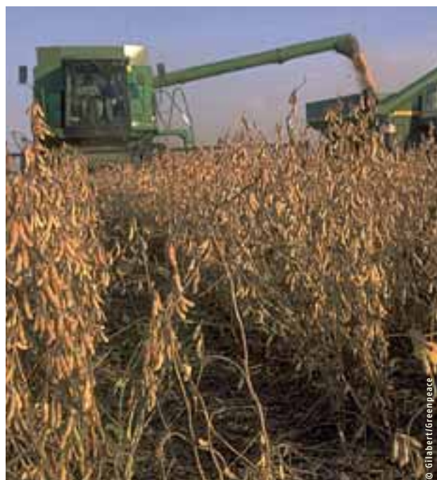
Culture de soja transgénique en Argentine

Les chiffres sont éloquentes: en 2003, près de la moitié (44%) de tous les herbicides vendus en Argentine contient du glyphosate. Les fermiers argentins cultivent souvent leur soja génétiquement modifié selon la méthode no till et aspergent leurs champs beaucoup plus souvent que leurs collègues américains; en moyenne 2,3 fois par an pour 1,3 fois aux États-Unis. De nombreux fermiers argentins optent pour un traitement burndown : avant de semer, ils aspergent le sol de glyphosate, de façon à faire disparaître en une fois toute la végétation indésirable. En 2003/2004, les Argentins ont utilisé 56 fois plus de gly-