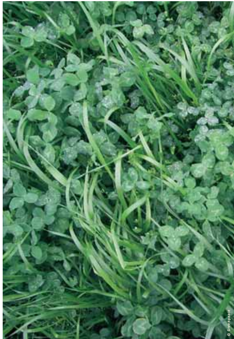
Le trèfle: riche en protéines et durable.

Certains cultivateurs prétendent qu'ils ne peuvent pas développer leur exploitation parce qu'ils n'ont pas assez de terre. Il est en effet impossible pour les exploitations qui fournissent plus de 15.000 litres par hectare de les produire de manière autonome, ce qui est déjà difficile