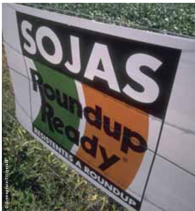
Soja transgénique Roundup Ready