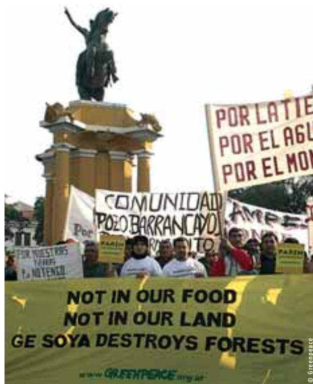
Manifestation en Argentine contre l'expansion du soja

Les entreprises du secteur du génie génétique prétendent que les OGM feront disparaître la faim de la planète. L'Argentine prouve une fois de plus qu'il s'agit là d'une promesse fallacieuse. En 2003, la récolte céréalière y a atteint un niveau record de 70 millions de tonnes, la moitié étant des fèves de soja. Et pourtant, la moitié de la population argentine vit sous le seuil de pauvreté et un quart n'a pas eu suffisamment à manger en 2004 (pour 5,7% en 1996). Cela représente 8,7 millions de personnes, dont près de la