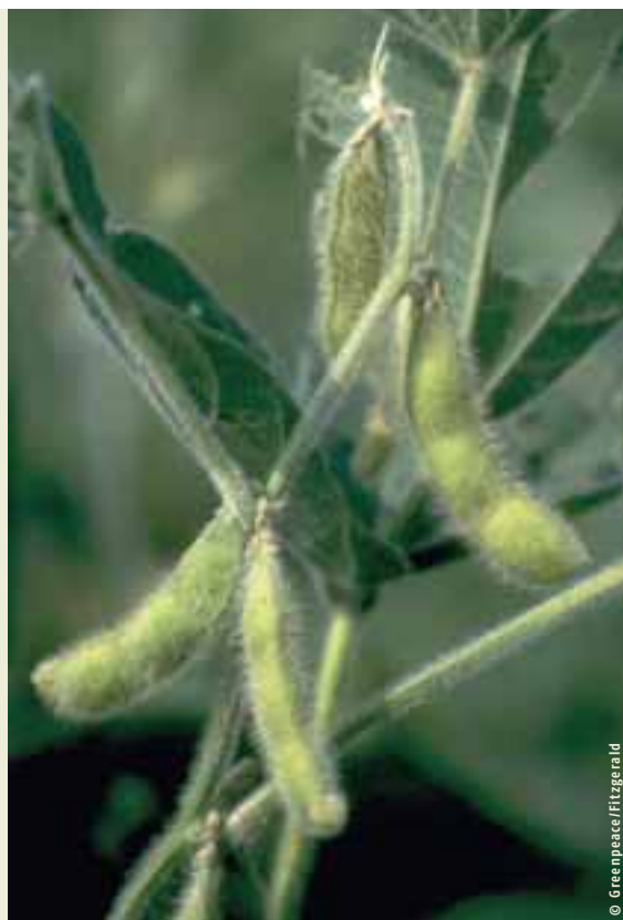
... et soja

En Belgique, la demande de soja pour l'élevage bovin peut être évaluée sur base de la consommation d'aliments composés et de la part de soja. Celle-ci oscille chaque année entre 177.000 et 676.000 tonnes de fèves de soja. La grande variation de la demande est due aux différences annuelles importantes au niveau de l'utilisation du maïs dans les aliments composés. Ces différences sont imputables au fait que la composition des aliments pour bétail dépend du rapport souhaité entre l'énergie et les protéines, de l'offre de matières premières et des prix mondiaux de celles-ci. Pour l'élevage des vaches laitières, il y aura suffisamment de soja non transgénique disponible en 2005.