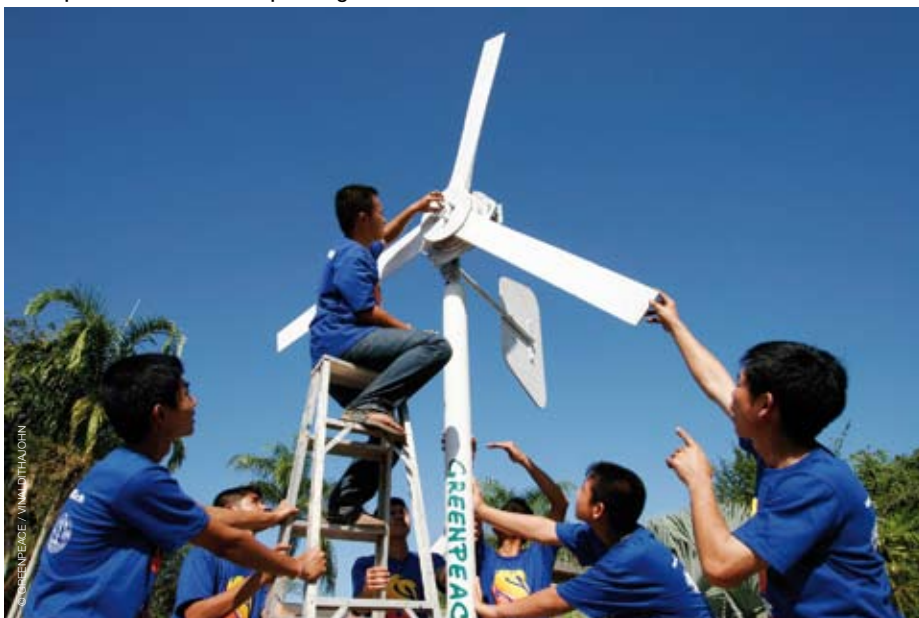
Greenpeace Thailand reikt oplossingen aan!

Greenpeace heeft bijna drie miljoen sympathisanten die de organisatie financieel steunen. Dat is een essentieel gebaar, omdat Greenpeace alle financiële hulp van de overheid, de politiek en de industrie weigert. Die financiële onafhankelijkheid biedt