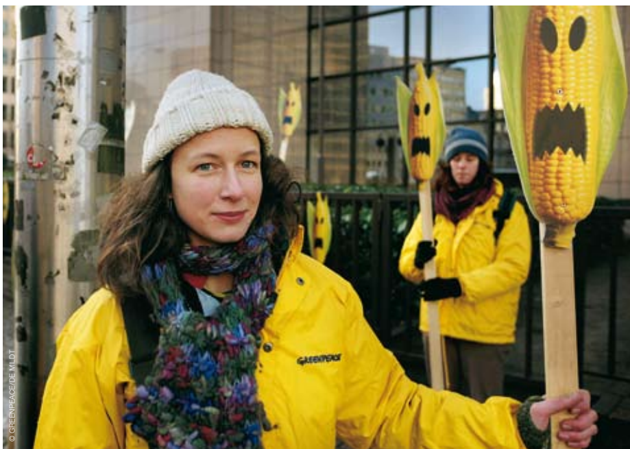
De wetgeving over ggo's gaat eindelijk de goede richting uit. Natuurlijk zal Greenpeace erover waken dat de beslissingen van de ministers worden opgevolgd.