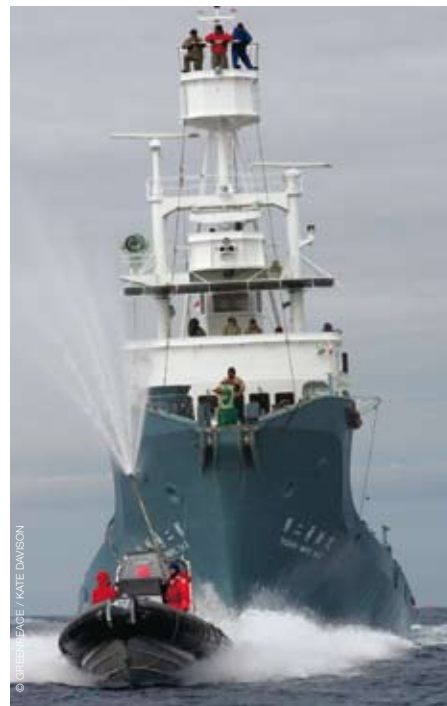
Greenpeace in actie tegen de walvisjacht in de verre wateren van Antarctica.

Met onze schepen kunnen we de meest afgelegen plaatsen op aarde bereiken. Greenpeace reisde al verschillende keren naar Antarctica om er gegevens te verzamelen over het smelten van het ijs. Met de beelden die we van die verschillende expedities meebrengen, kunnen we mensen overtuigen dat het dringend nodig is om de opwarming van de aarde tegen te gaan. Greenpeace reist ook regelmatig in de richting van de Zuidpool, om er actie te