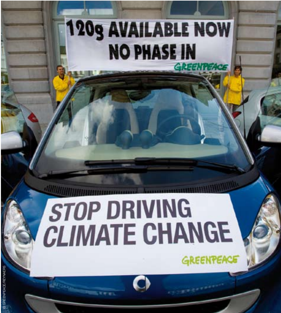
Greenpeace betoogt voor het Europees Parlement om de traagheid van de auto-industrie aan te klagen. Zuinige auto's zijn nu al beschikbaar op de markt, maar ze vormen nog altijd een uitzondering.

De kogel is door de kerk: de Europese onderhandelingen over CO 2 -regels voor auto's zijn afgerond. Jammer genoeg met een negatieve afloop. Europa houdt opnieuw de auto-industrie de hand boven het hoofd. Het klimaat en de consument zijn de dupe. Hoe is het zo ver kunnen komen?