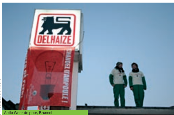
Actie Weer de peer, Brussel

Greenpeace Belgium wil dit in de eerste plaats ter beschikking stellen van zijn donateurs, maar wil met dit initiatief ook een voorbeeld geven, zowel binnen de sector als voor zijn diverse doelgroepen .