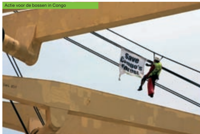
Actie voor de bossen in Congo