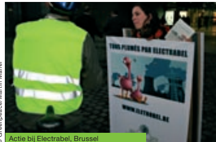
Actie bij Electrabel, Brussel