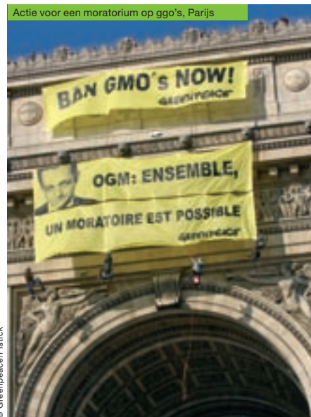
Actie voor een moratorium op ggo's, Parijs