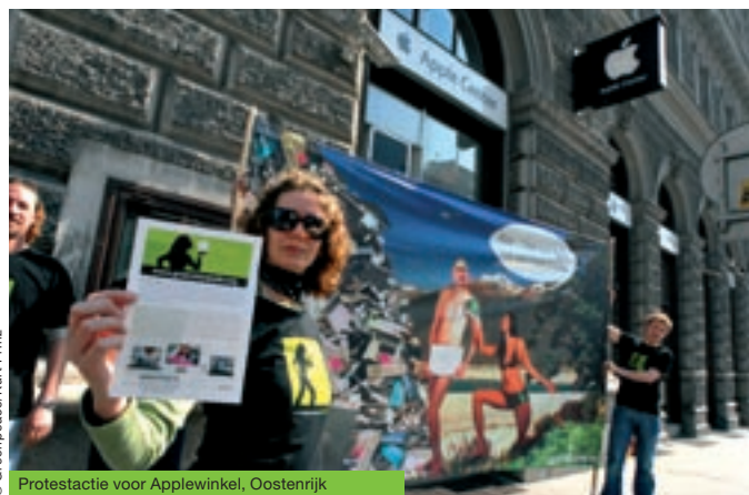
Protestactie voor Applewinkel, Oostenrijk