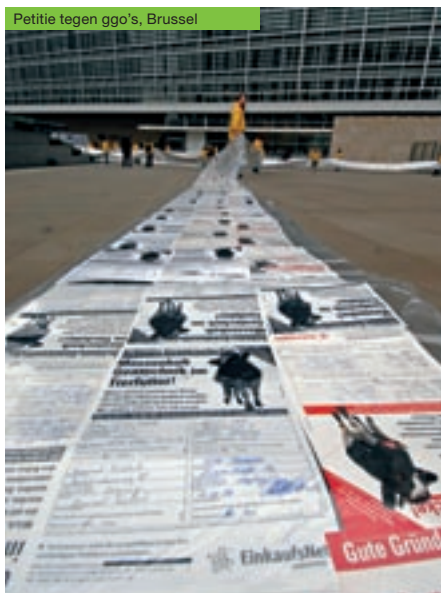
Petitie tegen ggo's, Brussel