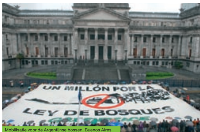
Mobilisatie voor de Argentijnse bossen, Buenos Aires