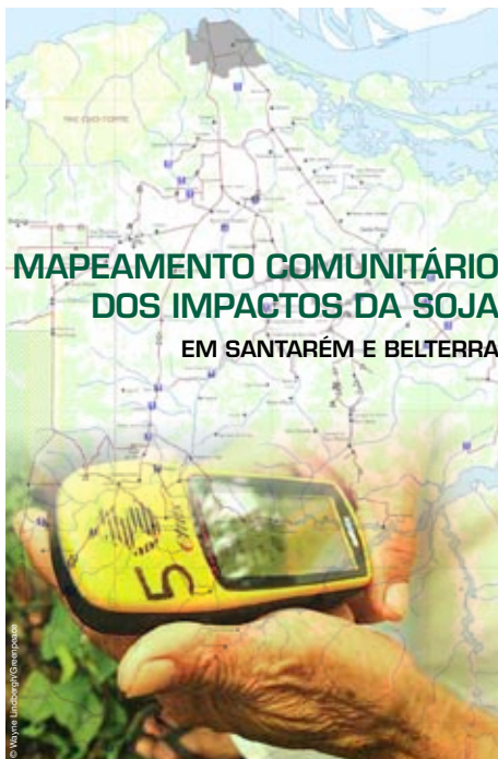
Capa do mapa comunitário dos impactos da soja.

Veja o mapa em: http://www.greenpeace.org.br/mapas/mapeamento-2.html