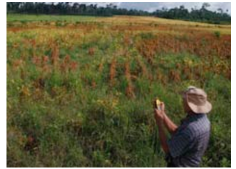
Participante do projeto de monitoramento comunitário marca com o GPS o ponto de uma plantação de soja na região de Santarém. Antes, a área era ocupada por floresta.