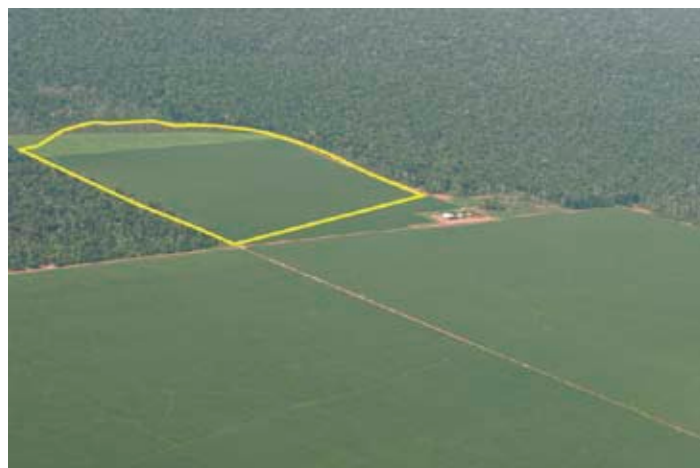
Uma das áreas desmatadas no bioma Amazônia durante a safra 2008/2009. A área, monitorada pelo Greenpeace, foi cultivada com soja (grifo na imagem).

O relatório com os resultados do monitoramento do Greenpeace para a safra 2008-2009 está disponível em: www.greenpeace.org.br/amazonia/pdf/boletimratoriaweb.pdf