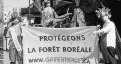
Greenpeace a accueilli la Commission Coulombe