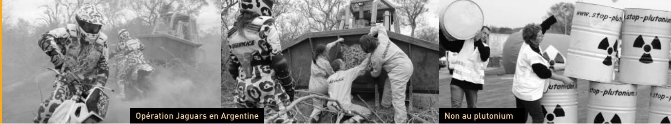
Opération Jaguars en Argentine