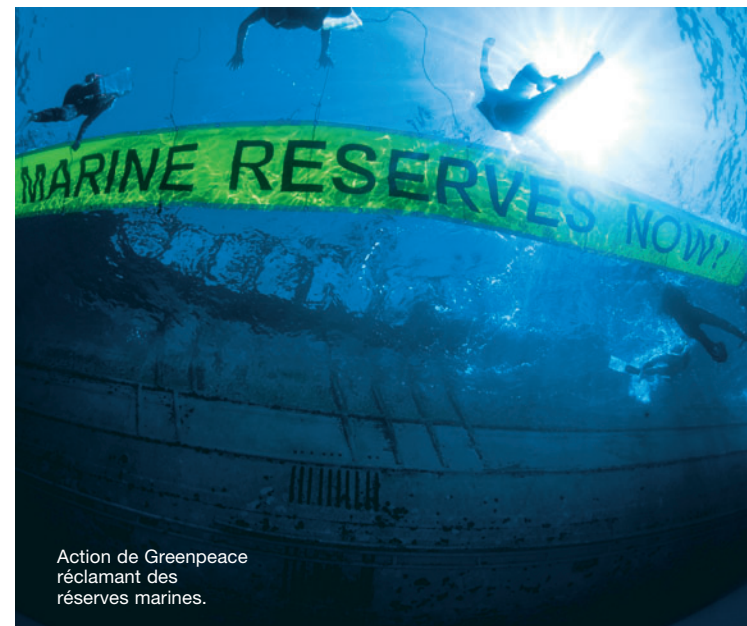
Action de Greenpeace réclamant des réserves marines.

Devenez membre de Greenpeace et aidez-nous à défendre nos océans. Visitez notre site ( www.greenpeace.ca ) ou téléphonez au 1.800.320.7183.