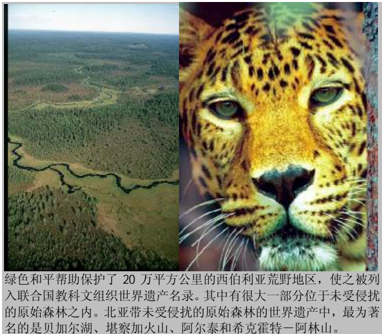
绿色和平帮助保护了 20 万平方公里的西伯利亚荒野地区，使之被列入联合国教科文组织世界遗产名录。其中有很大一部分位于未受侵扰的原始森林之内。北亚带未受侵扰的原始森林的世界遗产中，最为著名的是贝加尔湖、堪察加火山、阿尔泰和希克霍特-阿林山。

和其他森林地区一样，北亚的雪地森林也是数百个土著民族的家园。与北部的落叶松木林相比，南部阿穆尔河与日本海之间的雨林则拥有更加丰富的动植物多样性。非法和破坏性采伐对南部的威胁也要大于北部，而且随着木材贸易从俄罗斯扩展到中国、日本和朝鲜半岛，这种威胁也在加重。