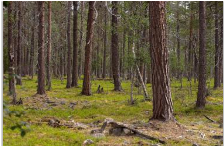
在俄罗斯的欧洲地区,绿色和平保护在 12 个已经发放采伐许可证的森林地区实现了停伐,其中就包括有未受侵扰的原始森林。该地区还正在新建两个自然公园。

欧洲只有 6.6%的森林是未受侵扰的原始森林。超过 90%分布在俄罗斯欧洲地区,3%分布在芬兰,另外 3%在瑞典。这些未受侵扰的原始森林,加上森林环绕的湖泊、河岸和沼泽,是很多动植物物种最后的避难所。这其中包括曾经生活在从斯堪的纳维亚到俄罗斯再到地中海各地森林的棕熊。