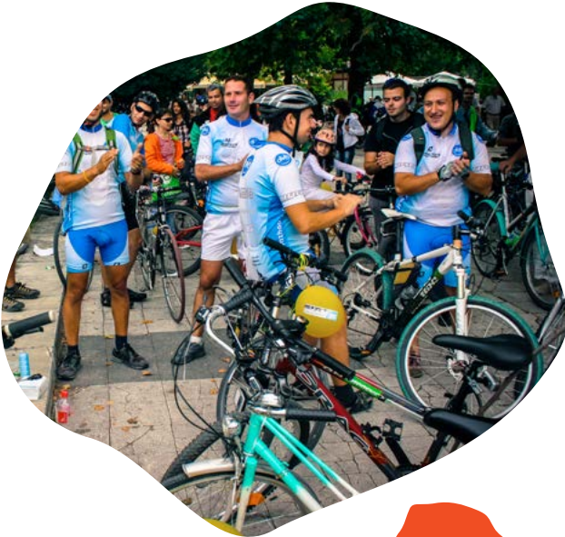
▲ Ice Ride en Sofía, Bulgaria

Puedes enviar a un listado local de medios como periódicos, revistas y foros de ciclistas la información para que la difundan. Algunas revistas de tema ambiental pueden estar interesadas en hacer publicidad del evento.