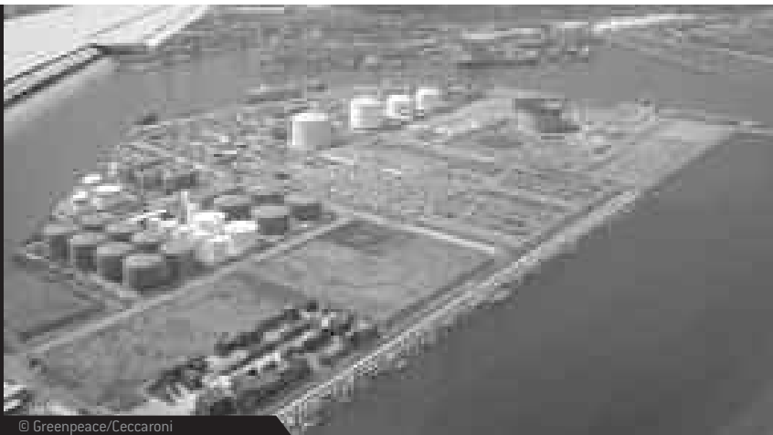
PORT DE BARCELONA