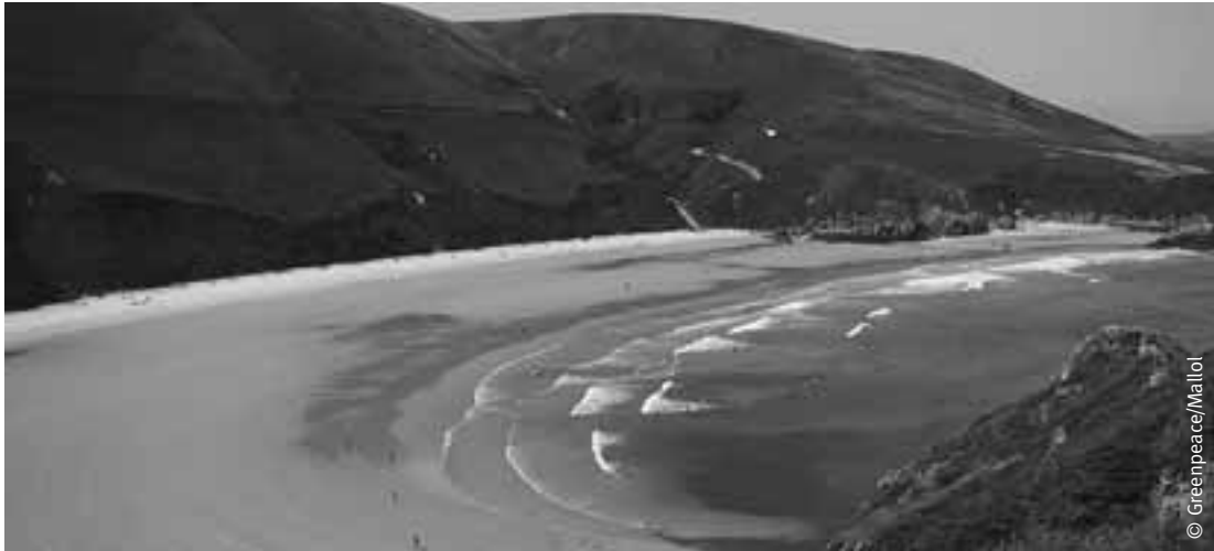
Playa de Torimbia, en Niembro.