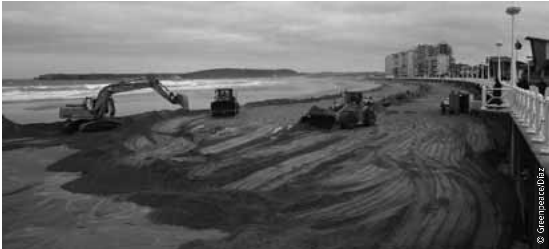
Regeneración de la Playa de Salinas, concejo de Castrillón.

Algunos de los proyectos planteados copian los modelos mediterráneos: urbanización privada y aislada con campo de golf para extranjeros, como el de Oviñana (Cudillero), que ha sido inicialmente rechazado por el Principado. Otros, como los que se pretende construir en las parroquias de Verdicio, San Martín de Podes y Manzaneda, tienen el propósito de revalorizar las viviendas que se construyen a su alrededor.