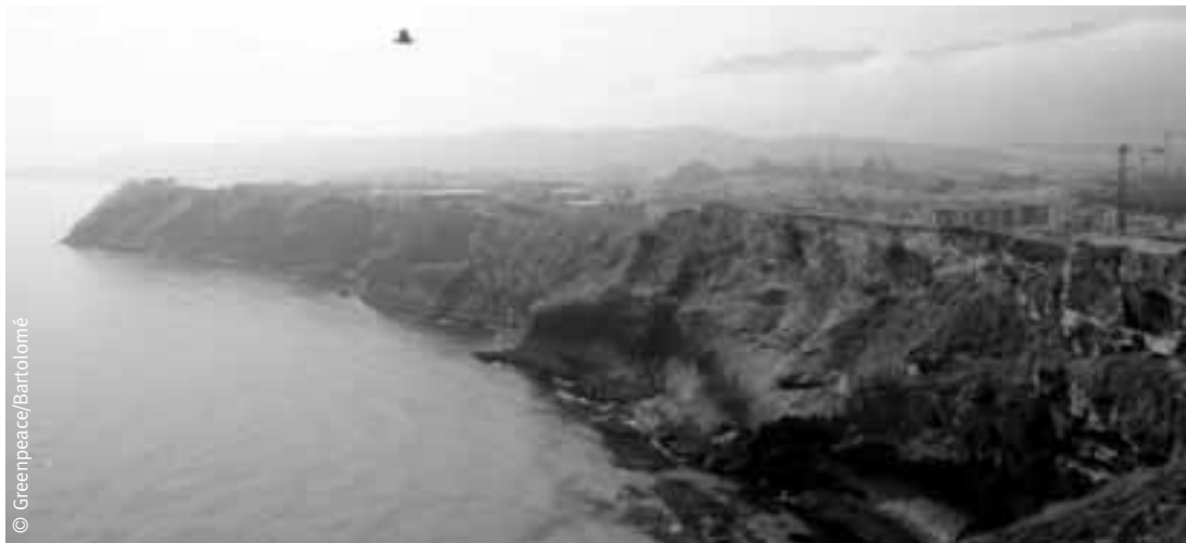
Construcciones en el litoral.