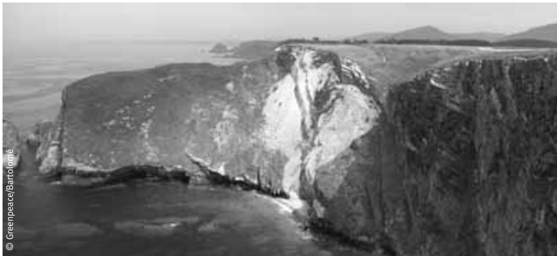
En Cabo Vidío hay proyectado un campo de golf con hoteles y viviendas.

rasa litoral dentro del Paisaje Protegido de la Costa Occidental. “Cudillero Ciudad-Jardín”, promovido por el grupo inmobiliario ANJOCA, constará de 240 viviendas unifamiliares y 600 viviendas en edificios 1 .