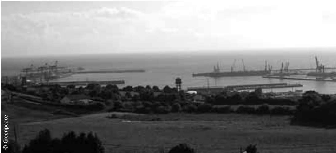
Puerto de El Musel, en Gijón (Asturias).

a los vertidos que se realizan a diario en las obras del puerto. En Luanco hay planes para construir un nuevo puerto deportivo. El Ayuntamiento de Coaña ha solicitado la construcción de una nueva instalación deportiva.