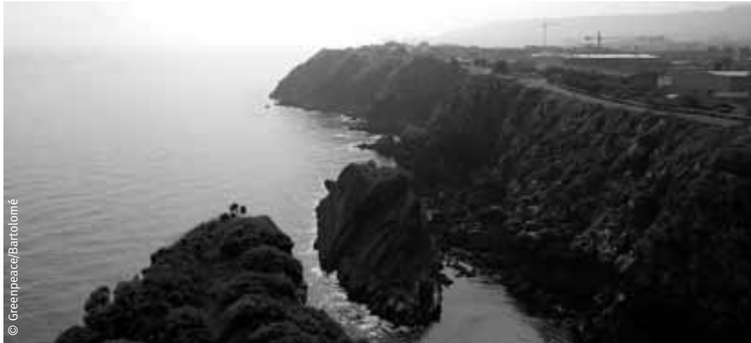
Llanes: uno de los mejores exponentes de la voracidad constructora.