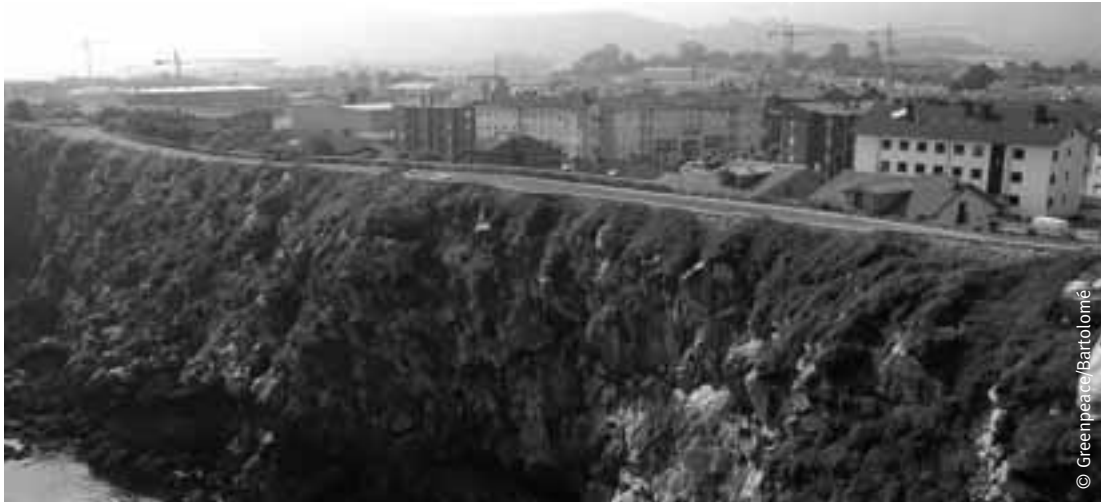
Las grúas son frecuentes en el paisaje asturiano.

Cada tramo finalizado de la Autovía del Cantábrico es “celebrado” por las inmobiliarias, cuyo objetivo es encontrar suelo barato, algo que ya no es fácil hallar en el resto de la costa peninsular. Ribadedeva, Llanes, Ribadesella, Colunga, Villaviciosa, Gijón, Corvera, Carreño, Gozón, Soto del Barco, Cudillero, Valdés, Navia, Tapia y Castropol se suman a la fiebre constructora.