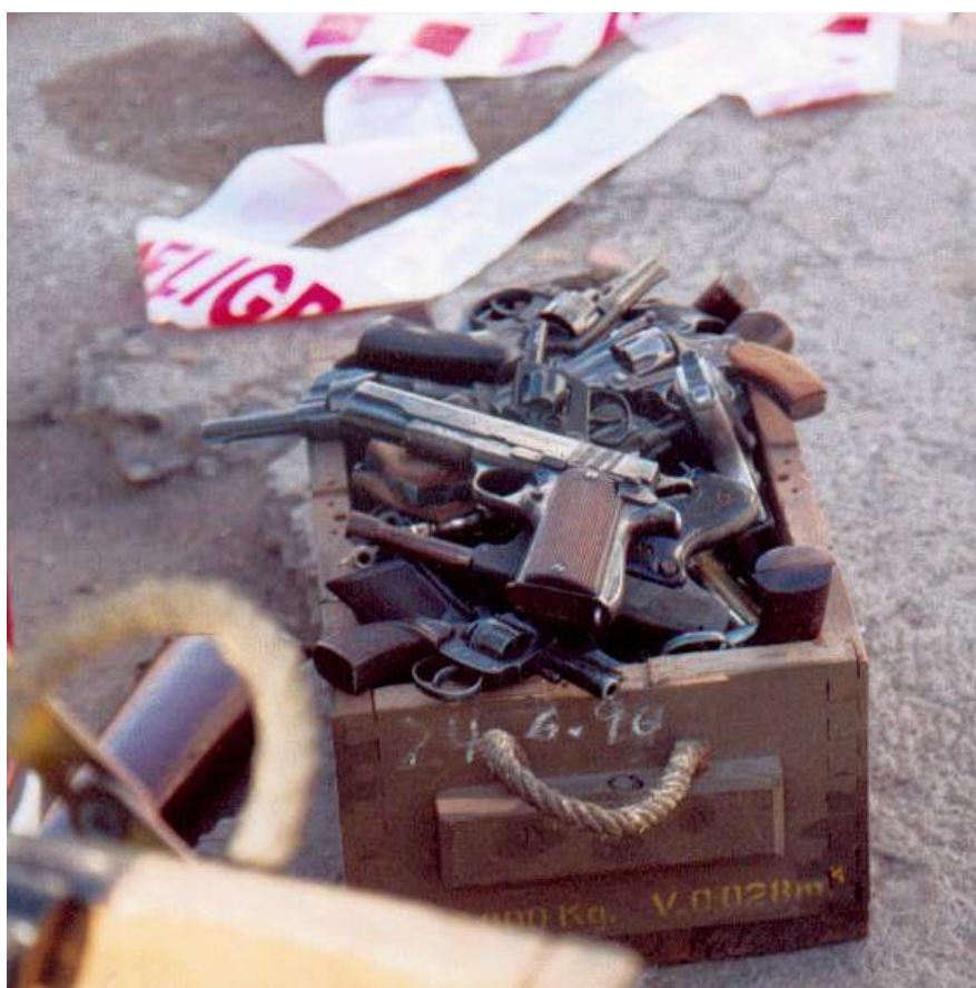
Pistolas españolas para ser eliminadas en un programa de destrucción de armas en Mendoza (Argentina)

Análisis de las Exportaciones Españolas de Armamento 2003