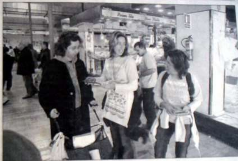
Los voluntarios de Greenpeace repartieron guías en el mercado del Olivar.

Grupos de activistas regalaron estas guías a los viandantes, siempre "cerca de centros comerciales porque es más fácil hablar con la gente y explicarles la situación de los caladeros y las especies".