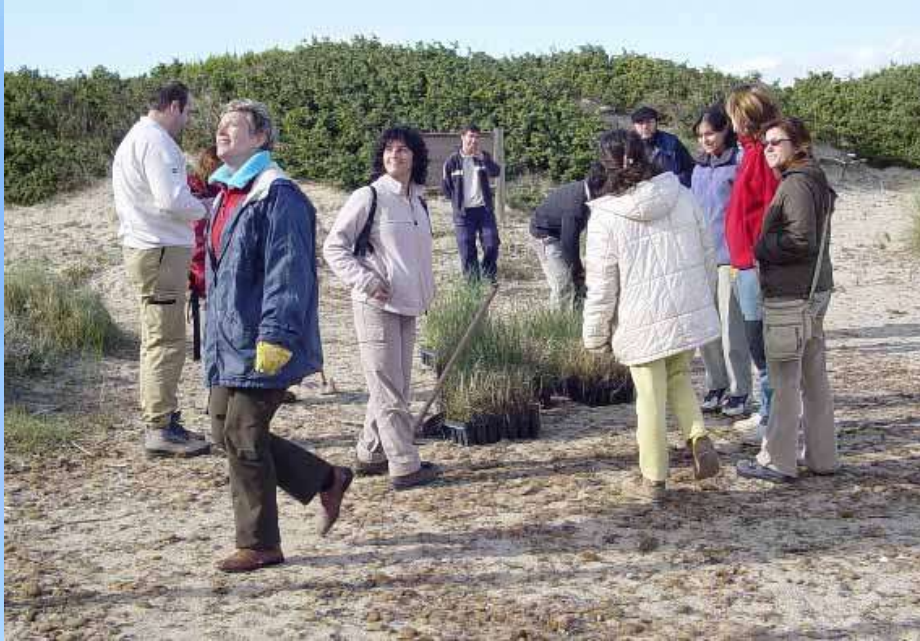
Repoblación de la playa de Muro con la asociación Amigos de los Parques – ABAP 26 noviembre 2005