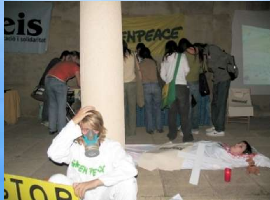
Feria de ONG's en la Universidad 11 octubre 2006