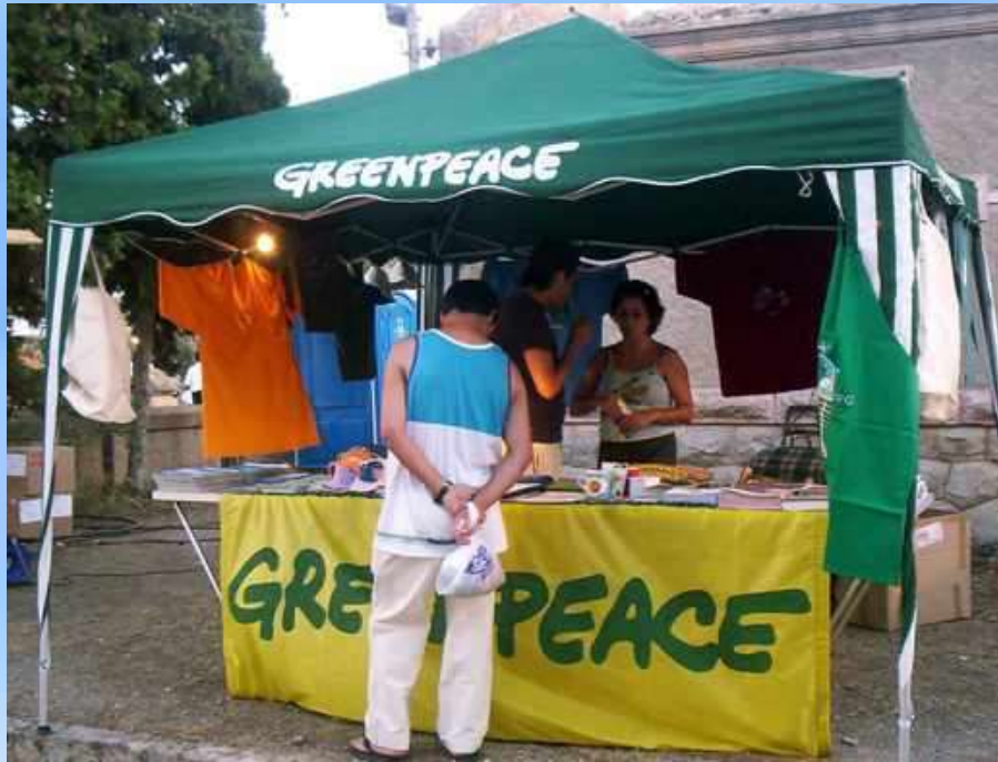
Feria nocturna de Sant Llorenç des Cardessar – 13 agosto 2005