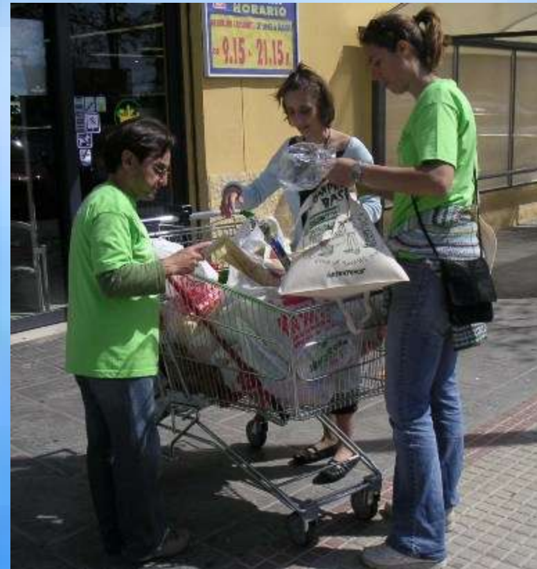
Tóxicos: reducimos los envases 1 abril 2006