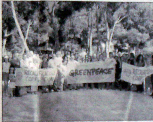
La protesta fue secundada por varios cientos de personas.

Los representantes de la plataforma SOS Can Vairet explicaron