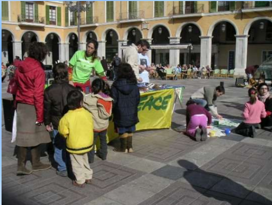
Jóvenes Amigos de los Bosques 11 febrero 2006