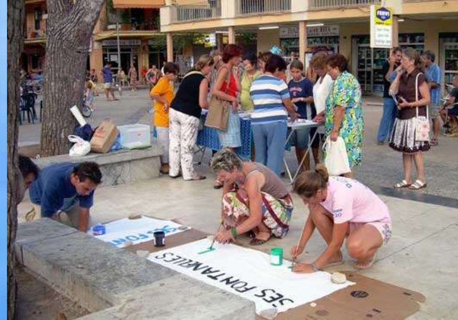
Jornada informativa con la Plataforma Ses Fontanelles 17 agosto 2006