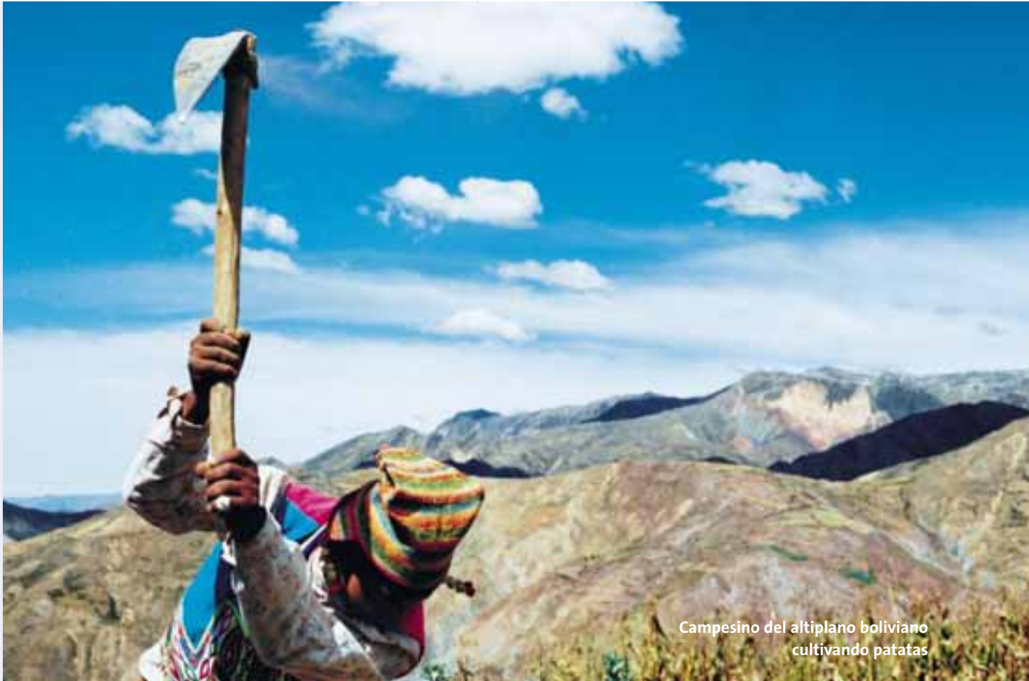
Campeño del altiplano boliviano cultivando patatas