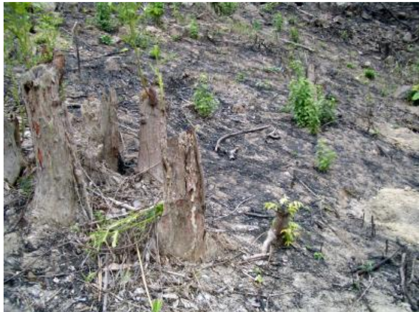
松涛水库水源林保护区:南家陆村毁的水源林地

多厘米的天然林被砍伐……2003 年 6 月间，松涛水利工程管理局库区管理区上报的材料称“当前，毁林开发的势头有所蔓延，相当一部分人(公司)打着退耕还林、营造纸浆林的