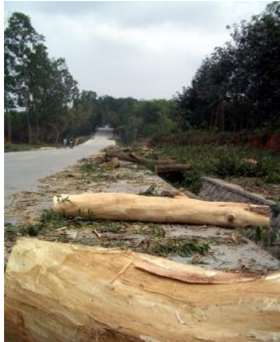
海南省老西线公路,儋州市到西培农场途中,还没来得及运走的刚刚被砍伐的公路护路林堆放在路边

“将国道 225 线 167KM 至 179KM、省道美洋线 18KM 至 30KM、县道东都线 25KM 至 35KM 的公路林,作为今年底更新改造的示范段,并在该公路两侧宜植林的地段宽度 5-10 米选用桉树 U6 种植”。 19 这意味着海南人民的公路防护林将变为金光集团的商品原料林。