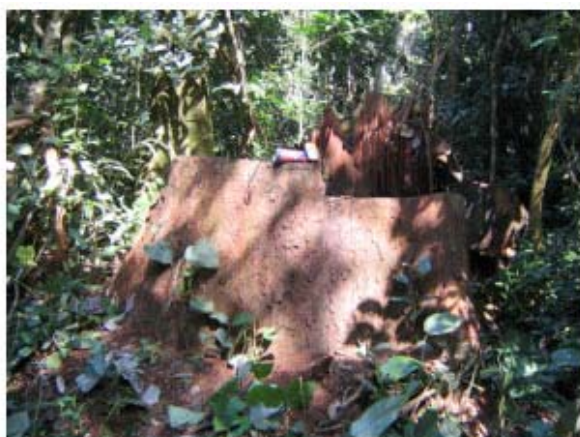
Figura 2 : ceppo di tali non marcato (AC n°1)

Nel 2002 la FIPCAM inizia lo sfruttamento della propria concessione, con l'apertura di una pista nella foresta comunitaria del villaggio di Bapilé. Gli abitanti del villaggio protestano contro la pista da loro considerata illegale. Durante l'apertura, la FIPCAM ha portato via dalla foresta comunitaria diversi tronchi (cinque iroko, un tali, un doussié e un sipo) 4 . La FIPCAM avrebbe abbattuto illegalmente ben 300 alberi di moabi attorno al villaggio di Bapilé, anche all'interno della foresta comunitaria. Gli abitanti del villaggio, continuano a protestare, bloccando i lavori, e si accorgono che non sono i mezzi della FIPCAM a rimuovere i tronchi abbattuti, ma quelli della Pallisco, chiaramente molto interessata al prezioso legno di moabi.