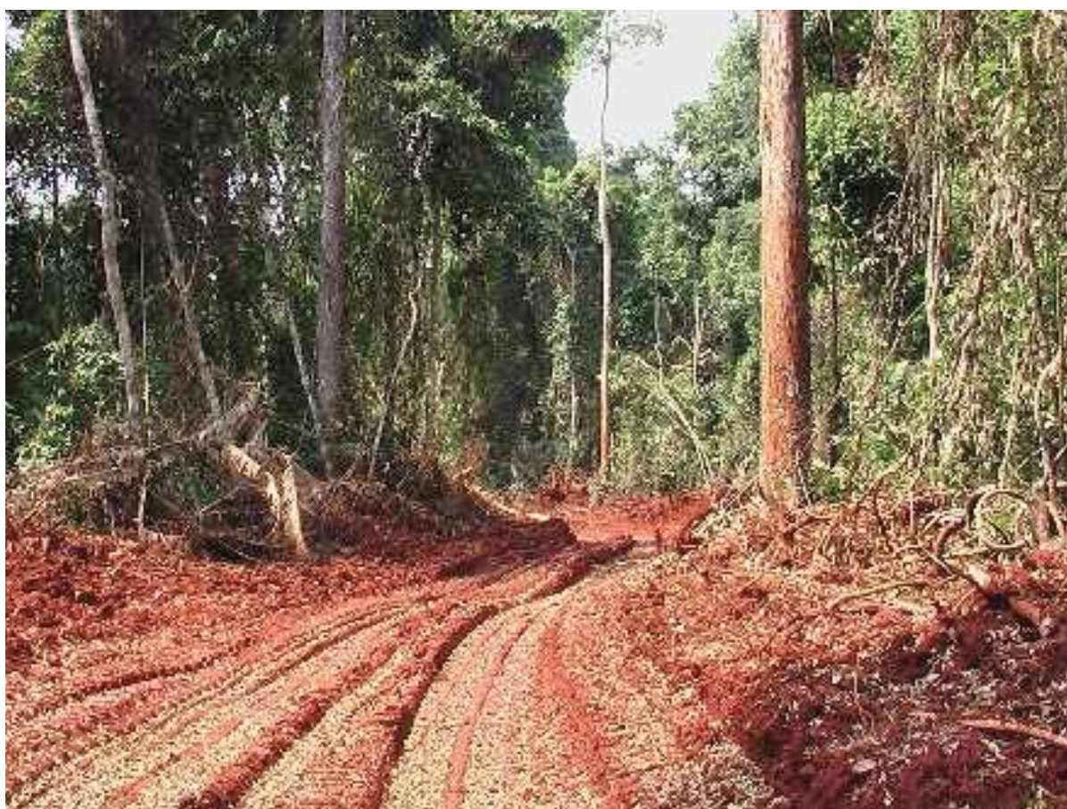
Figura 1: Una delle piste aperte illegalmente dai bulldozer della FIPCAM

Come un'impresa italiana si impossessa illegalmente di un milione di euro di legno.