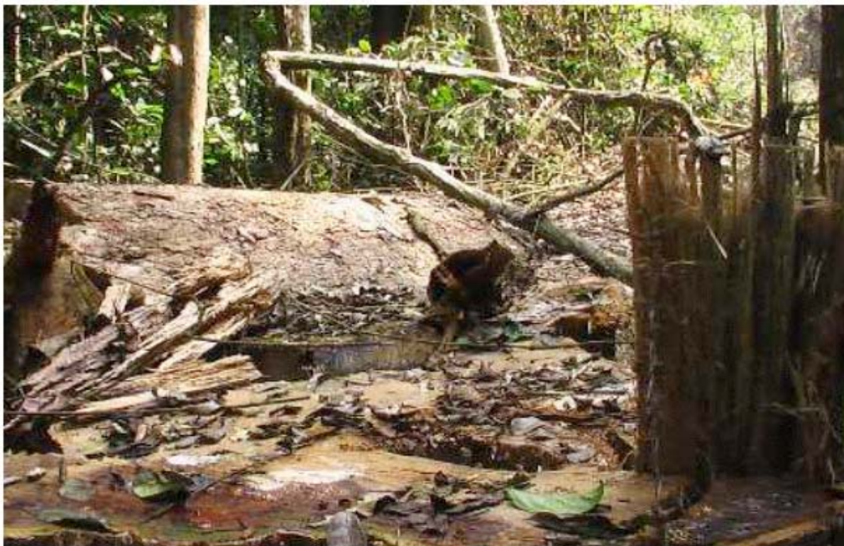
Figura8: Ceppo di uno dei numerosi alberi abbattuti illegalmente dalla FIPCAM e abbandonati in foresta

L'ispezione ha anche potuto constatare la presenza di numerosi alberi già abbattuti e apparentemente abbandonati in foresta.