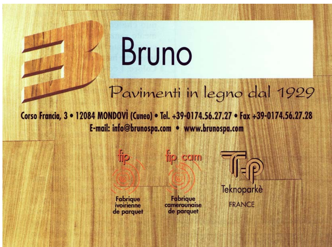
Figura 11: Pubblicità della Bruno spa sulla rivista Professional Parquet . Si nota ben in mostra il logo della FIPCAM.

Bruno spa vanta sul proprio sito web l'attenzione ambientale di FIP e FIPCAM: "Queste società hanno sviluppato processi produttivi orientati alla gestione durevole delle foreste" 9 . I clienti possono così credere di acquistare legno proveniente da pratiche rispettose dell'ambiente. In realtà possono acquistare legno proveniente da operazioni illegali.