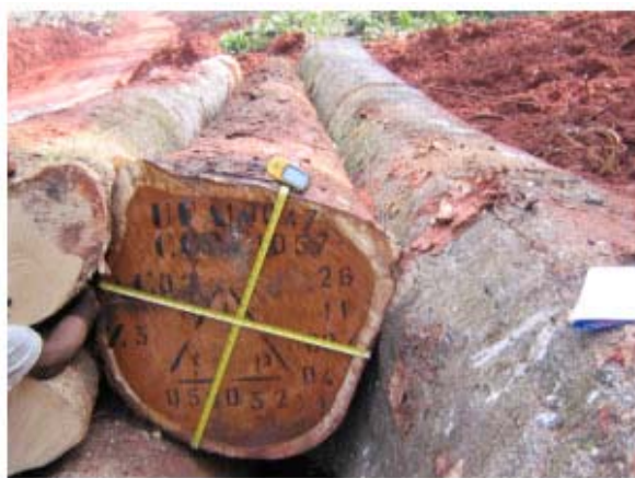
Figura 3 : tronco di doussié al di sotto del diametro consentito