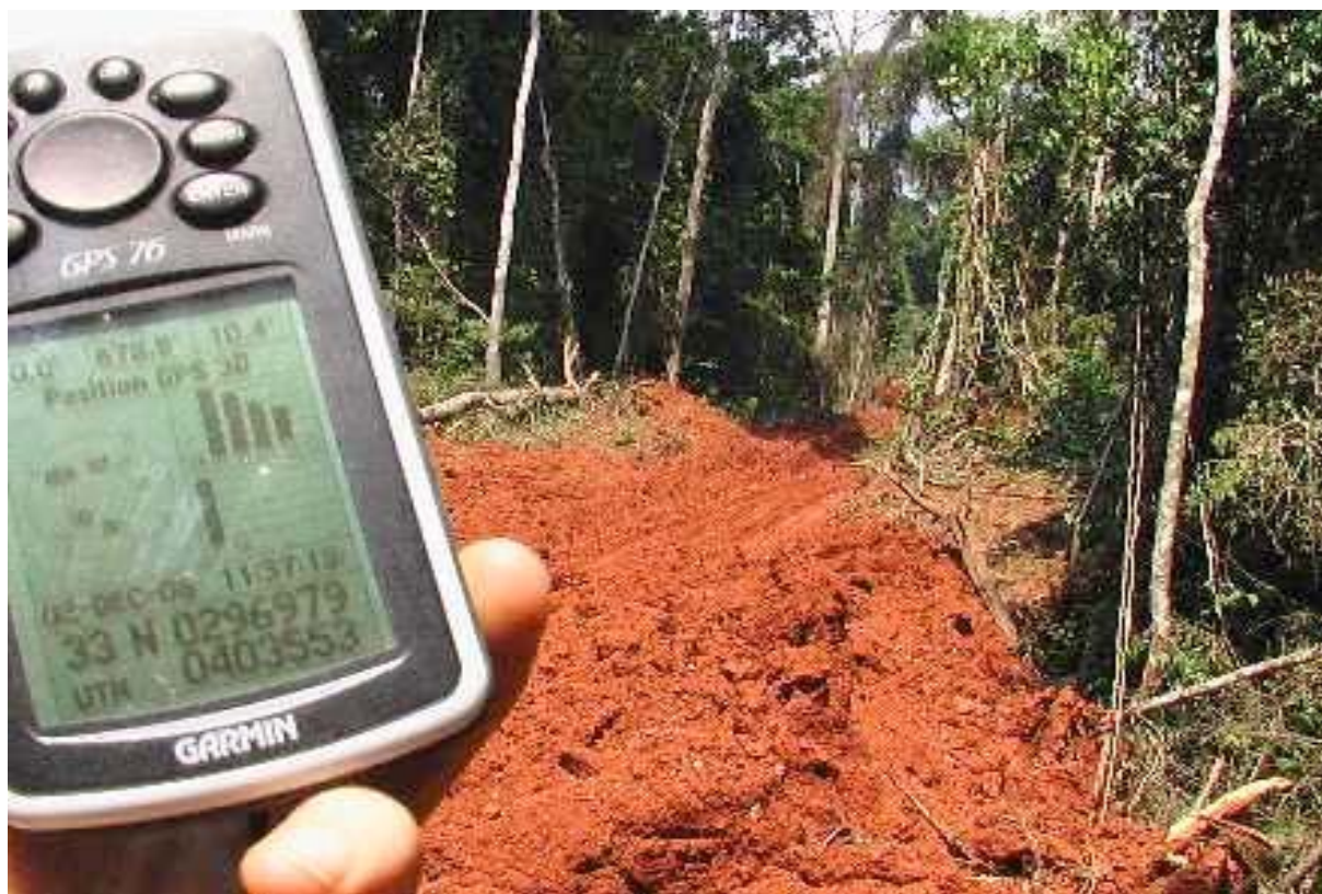
Figura 6: Una delle piste di trascinamento aperte illegalmente dalla FIPCAM (con i punti GPS) Sono state inoltre rilevate quattro aree di stoccaggio e decine di tronchi abbandonati, recanti il marchio della FIPCAM.

fiume che separa la propria concessione dalla foresta comunale di Messamena – Mindourou e ha aperto illegalmente diversi chilometri di piste (3-5km).