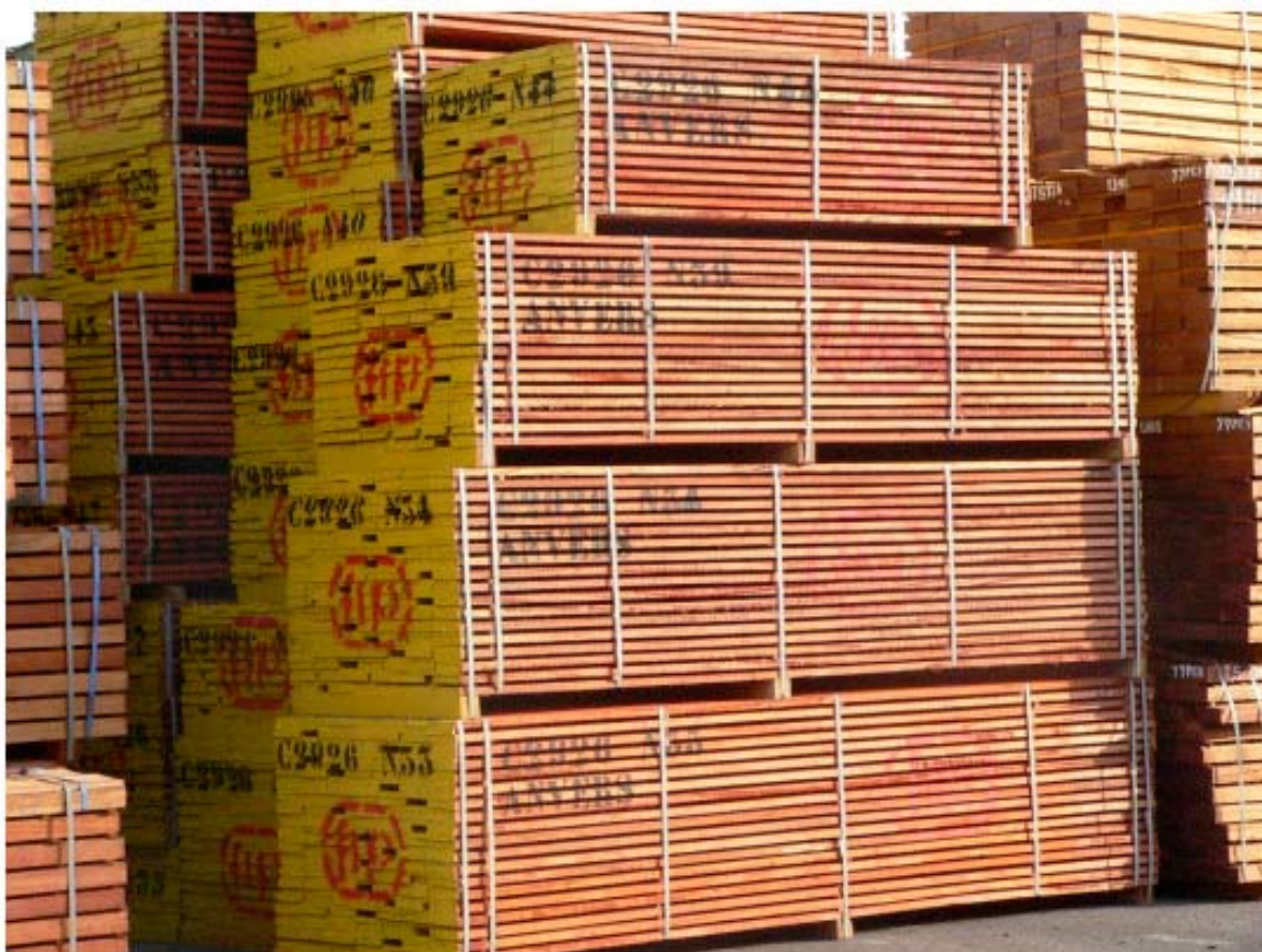
Figura 13: Un carico di segati della FIPCAM nel porto di Anversa.

Sulla base delle statistiche annuali del Porto di Douala (2003), è possibile calcolare che circa l'82 per cento del legname prelevato dalla FIPCAM venga esportato in Europa.