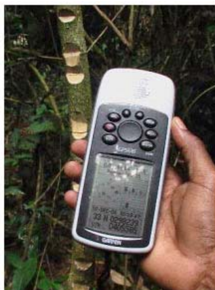
Figura 9: Un albero Bété marcato di e un picchetto con intagli che indicano il numero di alberi da abbattere

La successiva ispezione sul terreno ha evidenziato una pista di trascinamento lunga tra i tre e i cinque chilometri, e diverse centinaia di alberi abbattuti illegalmente.