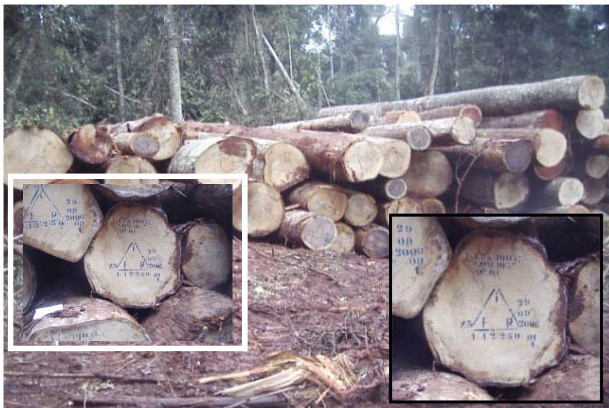
Figura 7: Area di stoccaggio. I tronchi sono marcati con il triangolo F.I.P. caratteristico della FIPCAM