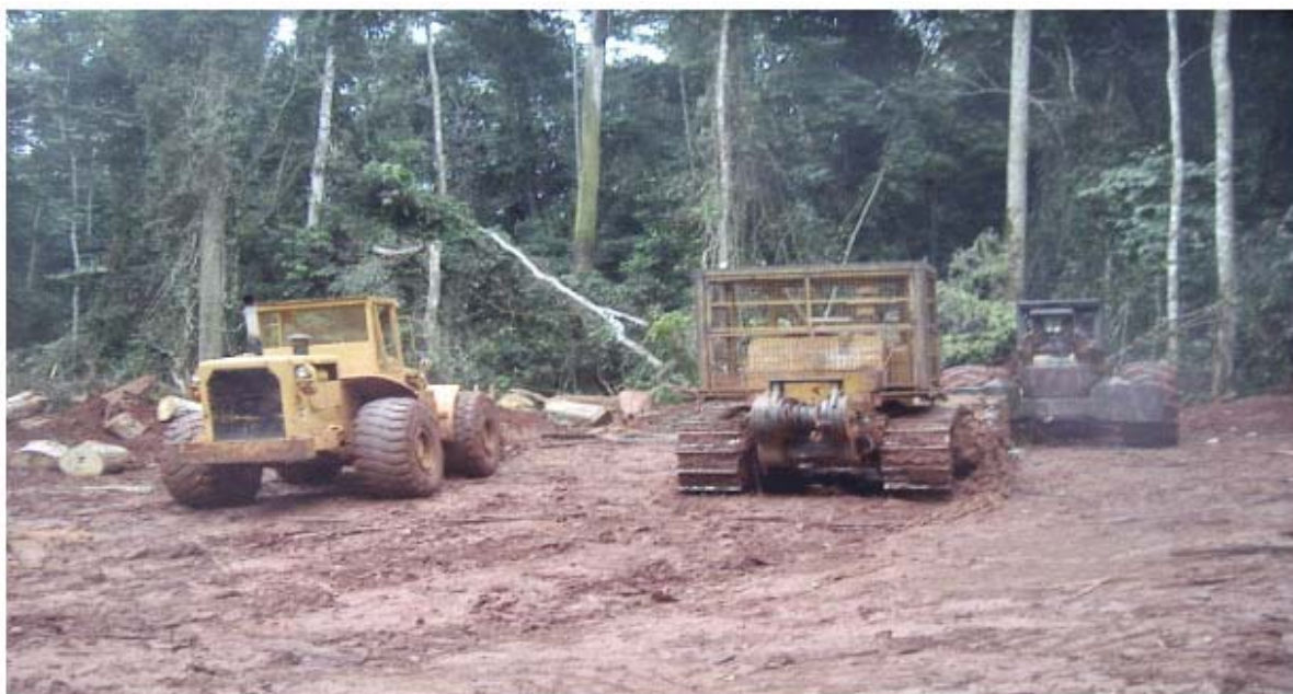
Figura 5: Bulldozer della FIPCAM

«Questa pratica, che sembra essere corrente nell'ambito della loro impresa, potrebbe tra l'altro aprire la via alla clonazione del legname o anche alla possibilità [...] di rimuovere il legname senza che il fisco camerunese ne sia a conoscenza." Il controllo della produzione e il seguito del recupero dei diritti e tasse con il Programma di protezione delle entrate forestali (Programme de Sécurisation des Recettes Forestières - PSRF) dipende da una registrazione affidabile del legname prelevato, nella documentazione di cantiere. Se la società FIPCAM dimenticasse o omettesse di compilare a posteriori la modulistica DF10 per il legname già rimosso e che dovrebbe essere già stato registrato, tale legname sfuggirebbe completamente alla tassa di prelievo.»