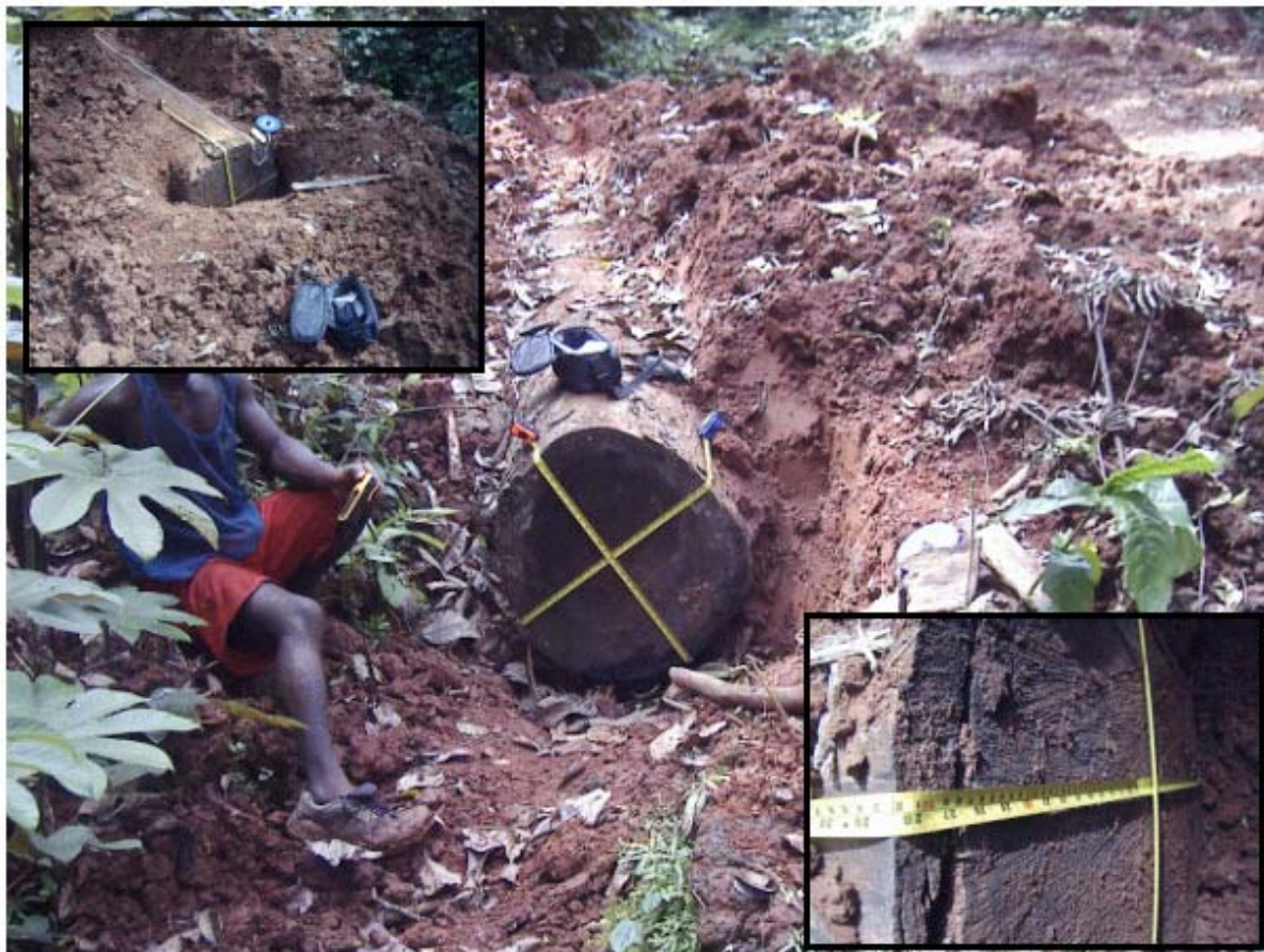
Figura 4: Tronco di sapelli abbattuto illegalmente e interrato in vista di un imminente controllo

Nel corso di una missione sul campo nel 2004 nelle parcelle n°1 e n°2 i ricercatori di Friends of the Earth hanno potuto rilevare diverse irregolarità, come la presenza di ceppi di tronco non marcati, e quindi abbattuti illegalmente. Secondo la testimonianza di un vecchio lavoratore della FIPCAM, si trattava di una pratica corrente. La stessa fonte aveva fatto menzione della pratica di interrare tronchi illegali con i bulldozer per nascondere le tracce, in vista di imminenti controlli. Una verifica sul posto, ha subito confermato questa pratica.