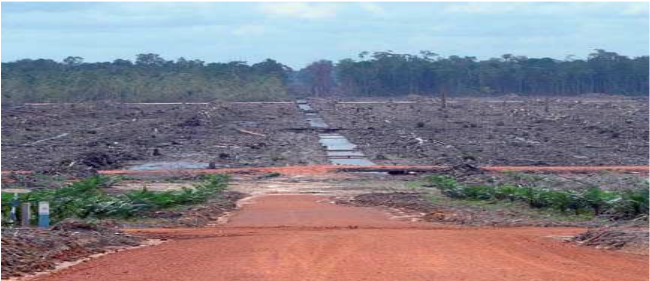
Foto 3: Conversione (tutt'ora in corso di una torbiera di tre metri di profondità nella proprietà PT SSS1 di United Plantations. I membri del villaggio fanno risalire l'avvio di queste operazioni all'inizio del 2008.