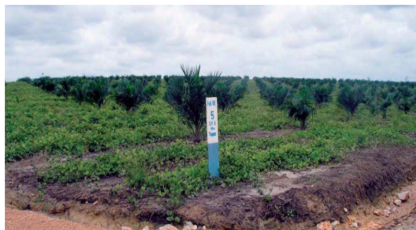
Foto 2: Foresta tagliata a raso nella proprietà di United Plantations (PT SSS1) nell'ottobre del 2008 a Runtu. Nel gennaio del 2008 UP aveva dichiarato di non aver ancora eseguito le operazioni di impianto.

Nel corso della presente indagine Greenpeace ha, inoltre, osservato che aree con un alto HCV sono state, e continuano ad essere, tagliate a raso almeno in una delle piantagioni di UP (PT SSS1). Alcune delle foreste distrutte da United Plantations per far spazio alle proprie piantagioni di palma da olio appoggiano su torbiere 20 o coincidono su aree identificate come habitat dell'Orango di Sumatra dal UNEP (Programma delle Nazioni Unite per l'Ambiente). 21 Inoltre, la RSPO ha adottato dei criteri per la definizione delle HCV che includono in maniera chiara la protezione di specie minacciate (come l'Orango di Sumatra) e delle foreste primarie e torbiere. 22