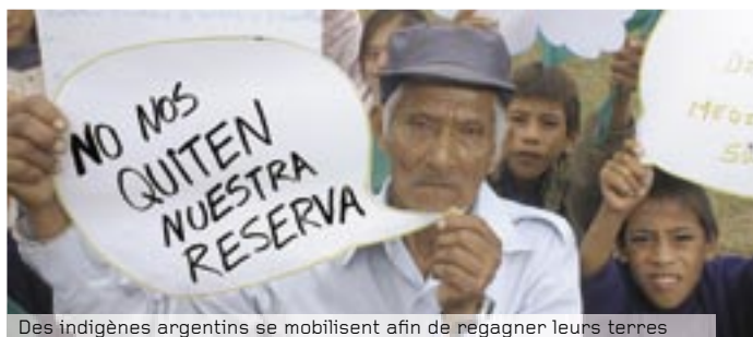
Des indigènes argentins se mobilisent afin de regagner leurs terres

Dans les premiers temps, il a semblé que les cultures transgéniques apportaient des avantages écologiques. Mais des effets négatifs ont fait leur apparition dès 2001. On a notamment observé que le taux d'utilisation d'herbicide