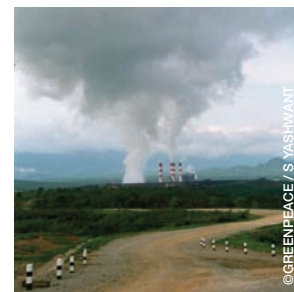
Photo Fumée des cheminées de la centrale Mae Moh alimentée au lignite (charbon brun) Mae Moh à Lampang, province de Thaïlande.