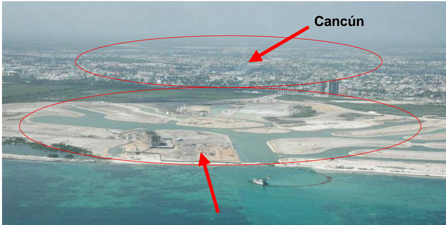
Puerto Cancún, zona de manglar deforestado