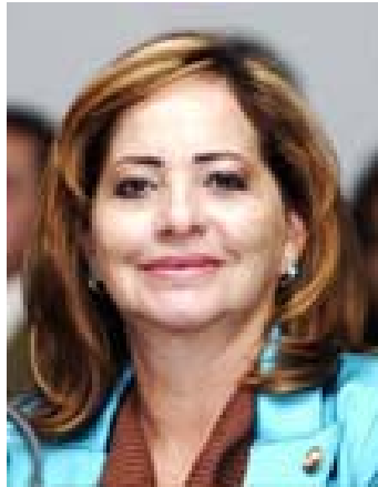
Senadora Eva Contreras