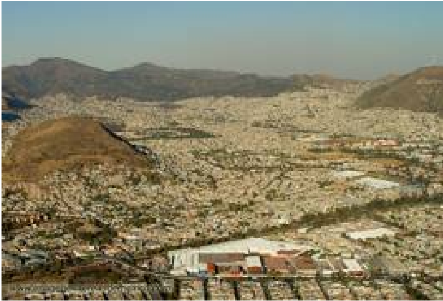
Cuautepec, Edo. De Mexico