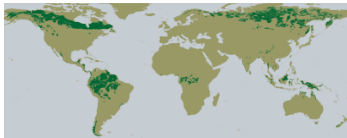
Les forêts anciennes restantes aujourd'hui