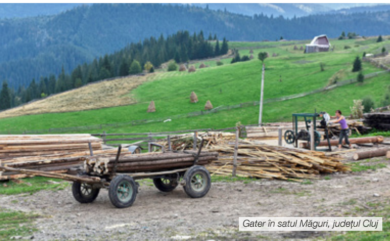
Gater în satul Măguri, județul Cluj