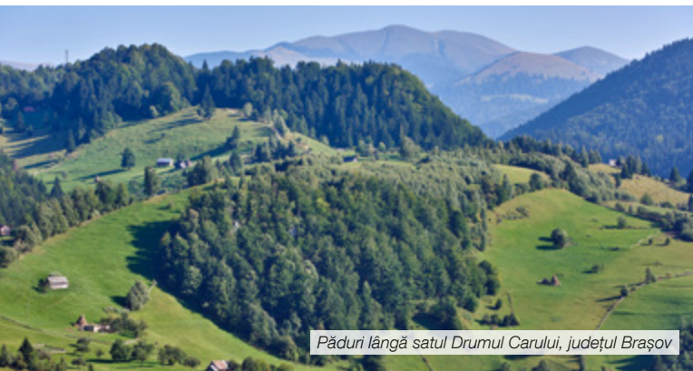
Păduri lângă satul Drumul Carului, județul Brașov