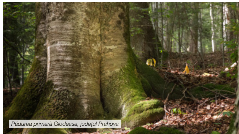
Pădurea primară Glodeasa, județul Prahova

Drepturile oamenilor și ale comunităților locale asupra proprietății și folosinței terenurilor și a resurselor trebuie respectate. Politicile silvice trebuie să sprijine identitatea și cultura comunităților locale, indiferent de natura proprietății pădurii.