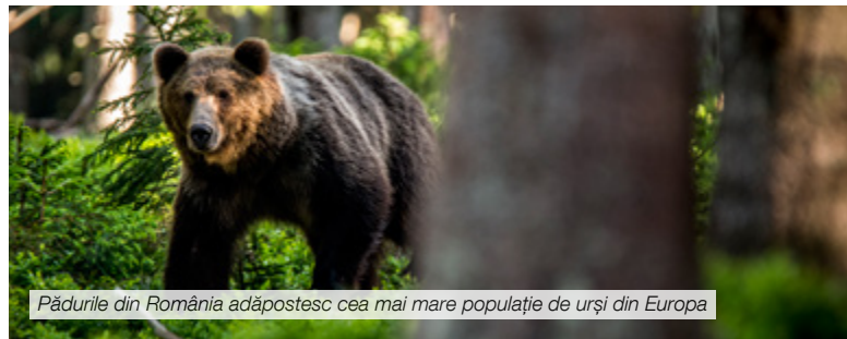
Pădurile din România adăpostesc cea mai mare populație de urși din Europa

Prin natura sa, România este o țară a fagilor, având cele mai întinse păduri virgine de fag din Europa. Unicitatea acestor ecosisteme a fost recunoscută prin acordarea statutului de patrimoniu mondial UNESCO pădurilor de fag din Slovacia, Ucraina și Germania. Opt păduri primare de fag din România vor fi de asemenea înscrise ca situri UNESCO, completându-se astfel o prețioasă moștenire naturală europeană.