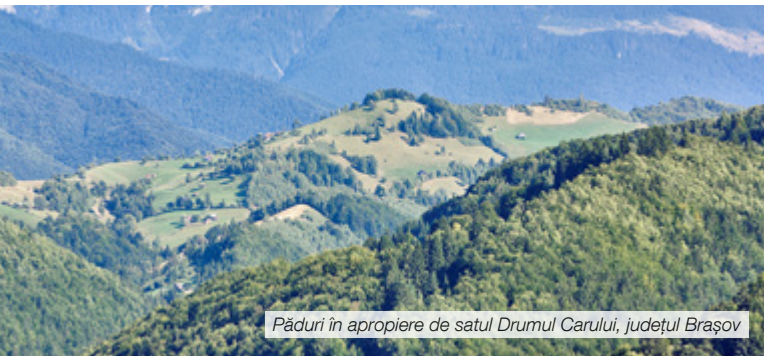
Păduri în apropiere de satul Drumul Carului, județul Brașov

Cu toate acestea, pădurile din România sunt amenințate: tăieri ilegale, practici forestiere iresponsabile, tăieri la ras inclusiv în zone protejate, tăieri în pășunile împădurite, o legislație slabă și o proastă aplicare a legii au dus la pierderea și degradarea pădurii. Situația actuală servește intereselor câtorva, sacrificând interesele întregii societăți românești. Folosirea eficientă a pădurii din perspectivă economică – cu respectarea valorii ei ecologice – și distribuția echitabilă a beneficiilor derivate către întreaga societate românească sunt împiedicate de corupția generalizată. Susținem că, în schimb, pădurile din România trebuie protejate, gestionate responsabil, dezvoltate și perpetuate, cu scopul de a întreține și