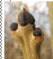
Почки ясеня обыкновенного

Внимание: в населенных пунктах часто встречаются ясени американский и пенсильванский, завезенные в Европу из Северной Америки. Их семена собирать не следует. Эти деревья очень похожи на ясень обыкновенный, но хорошо отличаются по цвету почек: у ясеня обыкновенного они черные, а у американского и пенсильванского – коричневые.