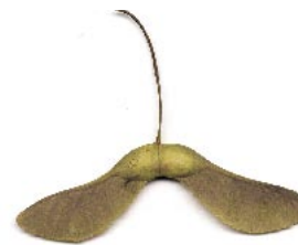
Семена клена остролистного