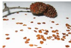
Семена и шишечки ольхи

Семена серой ольхи собирают вместе с шишечками в октябре или ноябре. При высушивании в комнате на второй-третий день из шишечки начинают выпадать семена.