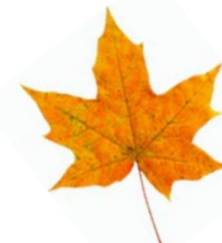
Лист клена остролистного