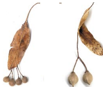
Семена липы мелколистной

Внимание: в населенных пунктах для озеленения часто используют липу крупнолистную. В естественном состоянии она растет в Средней и Южной Европе, а в наших лесах не встречается. Ее семена собирать не нужно.