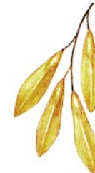
Семена ясеня обыкновенного