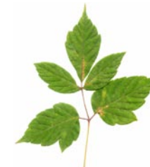
Лист клена ясенелистного