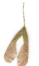
Семена клена ясенелистного

Внимание: в населенных пунктах часто встречается клен ясенелистный, также завезенный из Северной Америки, и много других видов кленов, которые собирать не следует. Клен ясенелистный, например, очень активно размножается и вытесняет из естественных экосистем многие местные виды. Поэтому нам нужны только семена клена остролистного.