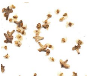
Семена и чешуйки березы

Семена березы бородавчатой созревают в июле-августе. Их проще всего собрать с нижних веток невысоких молодых деревьев. Если семена созрели, сережки с семенами начинают сами постепенно рассыпаться. Лучше собирать сережки целиком - после высушивания они распадутся на отдельные семенные чешуйки и семена.