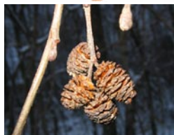
Шишечки ольхи на дереве