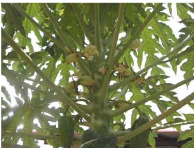
ลักษณะลำต้น ผล และดอกของมะละกอ

ในประเทศไทยส่วนใหญ่นิยมปลูกมะละกอตามหัวไร่ปลายนานาและที่ว่างในบริเวณบ้าน เพื่อบริโภคภายในครัวเรือน ส่วนการปลูกเป็นแปลงขนาดใหญ่เป็นการปลูกเป็นการค้าเพื่อส่งโรงงานอุตสาหกรรม สถิติจากกรมส่งเสริมการเกษตร ในปี 2546 1 มีพื้นที่เพาะปลูกมะละกอ 139,835 ไร่ พื้นที่ที่ให้ผลผลิตแล้ว 108,338 ไร่ ผลผลิตรวม 306,474 ตัน ส่วนใหญ่ใช้บริโภคภายในประเทศ