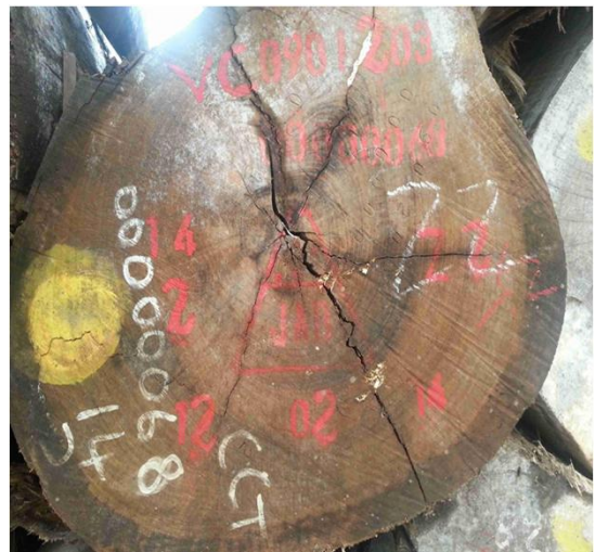
Une grume portant le marquage de la CCT et de la VC 09 01 203 de La Socamba dans le port chinois de Zhangjiagang. 14/08/2014.

Les violations de la Loi forestière peuvent entraîner la suspension ou, en cas d'infractions répétées, l'annulation du titre ou du permis d'exploitation (art. 65 de la Loi n° 94/01). Étant donné qu'il n'a pas été possible d'explorer toutes les routes d'exploitation forestière ni tous les chemins de débardage de la zone, les infractions observées pourraient bien n'être que le sommet de l'iceberg.