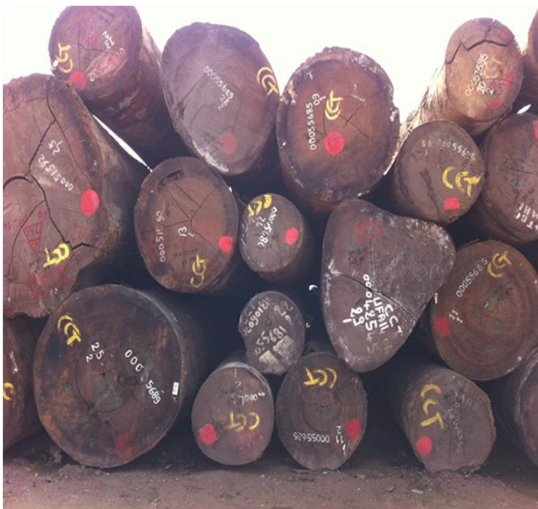
Un tas de grumes de la CCT dans le port chinois de Zhangjiagang. La grande grume au centre gauche de la photo porte le marquage de la VC 09 01 203 de La Socamba. 25/03/2015.