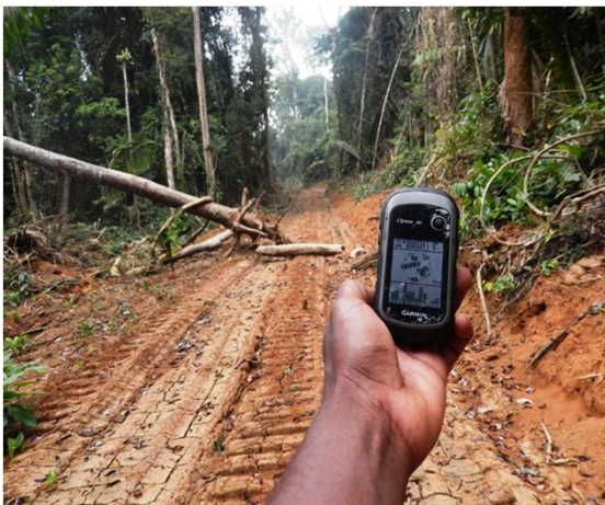
Une grume portant le marquage de la VC 9 1 203 de La Socamba et la date d'abattage du 3 septembre 2015, dans la forêt communale de Djoum, à 2°37'32,06" N et 12°42'50,62" E, à plus de 8 km en dehors de la zone couverte par le titre d'exploitation. 15/01/2016.

La Socamba aurait mis un terme à ses activités et quitté la région vers octobre-novembre 2015, peu avant l'expiration de la vente de coupe.