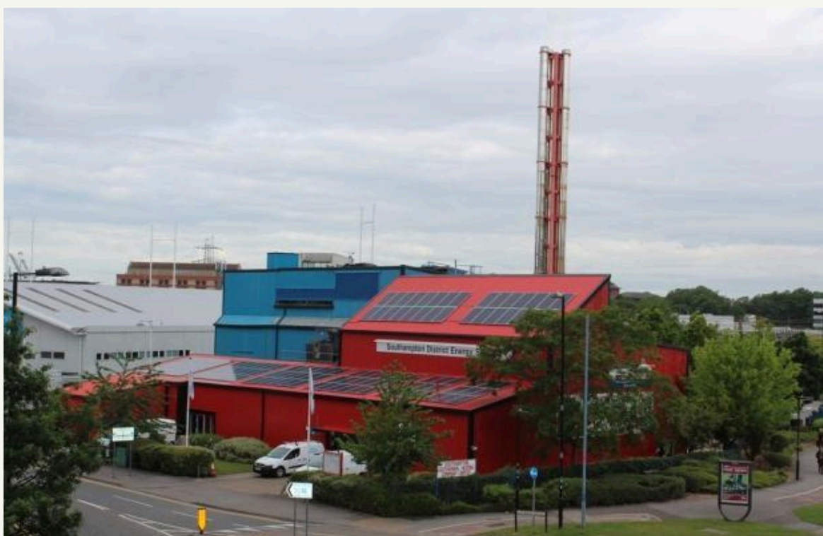
Фигура 5. Southampton District Energy Scheme 48 снабдява над 2500 (постоянно увеличаващи се) абоната с централизирано отопление и охлаждане на конкурентни и пазарни цени. Разполага с 6,7 MWe когенерационна геотермална инсталирана мощност, както и с 13,1 MW абсорбционни чилъра за охлаждане. Дълбочината на сондажите е 1800 м, а температурата на горещия флуид от сондажа достига 76°C.