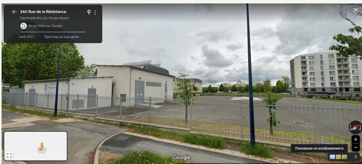
Фигура 4. Геотермалната отоплителна централа Dammarie-les-Lys. 47 Покрива 90% от нуждите за отопление и топла вода на 4000 домакинства, или около 30 GWh годишно.

2. За разлика от останалите ВЕИ източници, тя е постоянна и не зависи от климатичните условия, часовете на деня и годишните сезони. Централите на биогаз и биомаса използват субпродукт за своята енергия – това означава, че са зависими от наличността на първичния продукт.