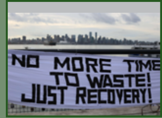
Déroulement de bannière à Vancouver