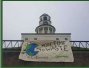
Déroulement de bannière à Halifax