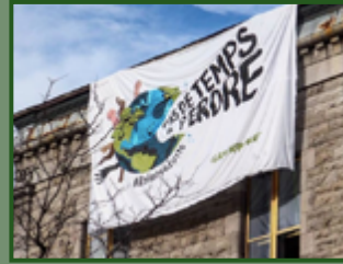
Déroulement de bannière à Montréal