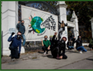
Déroulement de bannière à Toronto