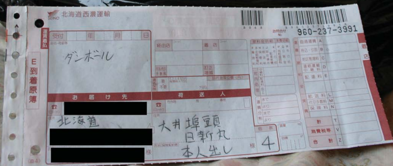
2008年4月16日 グリーンピース・ジャパンが確保した横領鯨肉の箱の品名欄には「ダンボール」と書かれた配送伝票が貼られていた