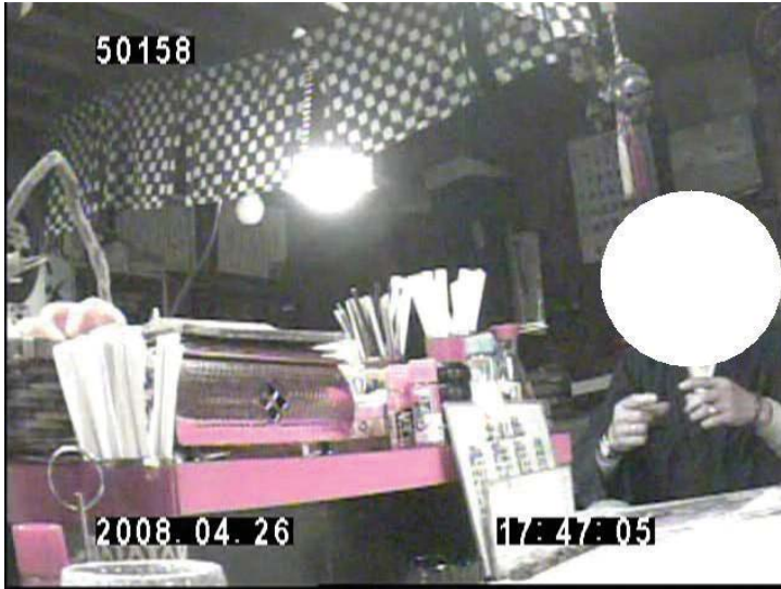
2008年4月26日 広島県内の寿司屋の男性