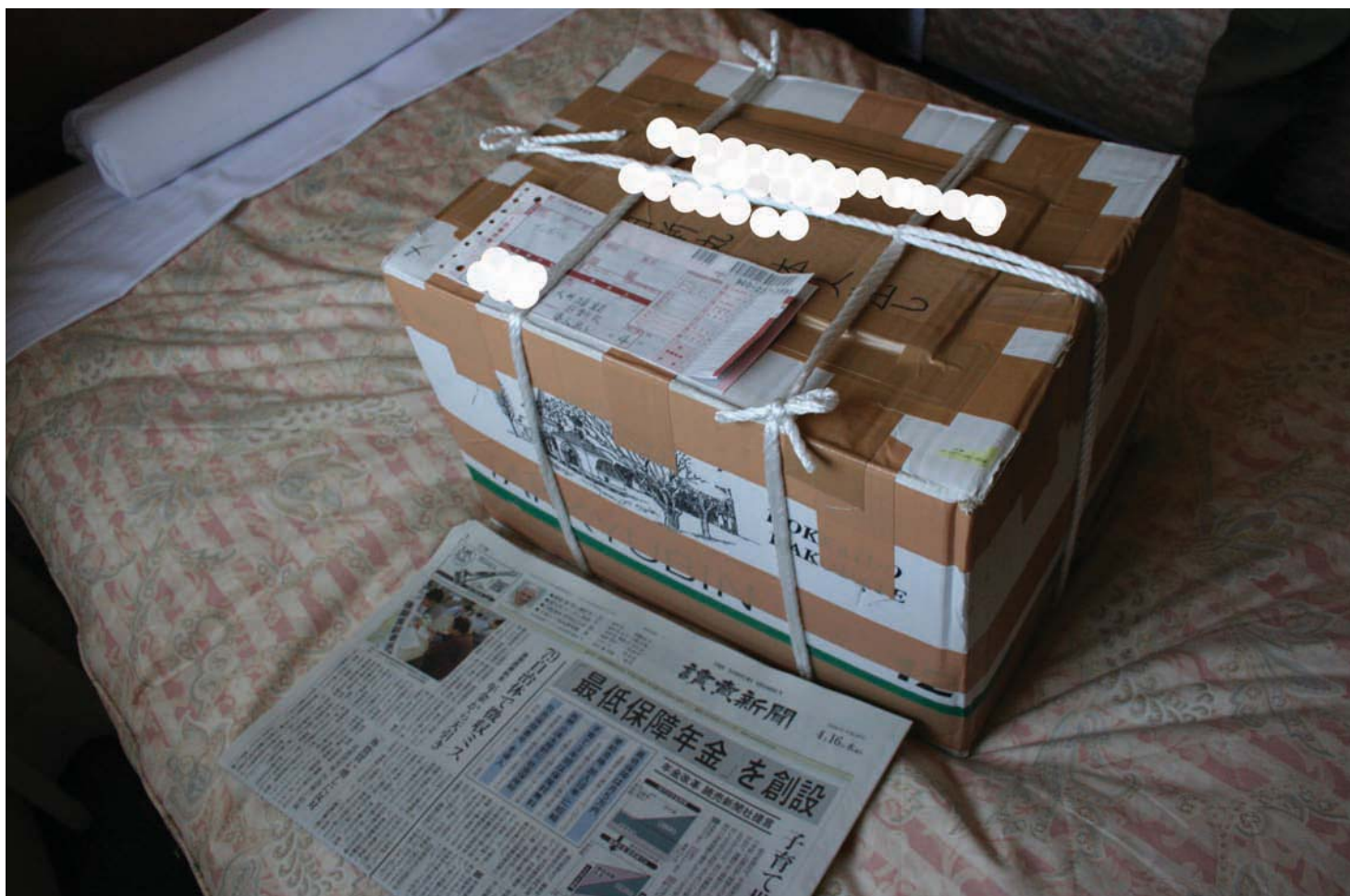
2008年4月16日 青森市内のホテルに持ち帰った箱と日付の確認のために並べられた当日の読売新聞

これらの肉は、日新丸の船上で鯨ベーコンの下ごしらえのために生の状態から直接数カ月間塩漬けし、熟成させたものと見られる。日新丸が調査副産物として販売に付す鯨肉はすべてそのまま冷凍されてしまうため、生の状態から直接塩漬け加工されたものは価値が高いことも予想される。市場では、ミンククジラのベーコンは1キロ2万円以上で販売されている。今回の畝須の実際の市場価値は不明だが、最終加工されていないことを考慮しても1キロ5千円から1万5千円程度の価値はあると予想され、23.5キロの箱では1箱11万円から35万円の価値がつくことになる。この箱を送った船員は同様の箱4箱を自宅に送っており、これらが同様の鯨肉を含むものだとしたら、44万円から140万円の価値のある鯨肉を自宅に日新丸から送ったことになる。