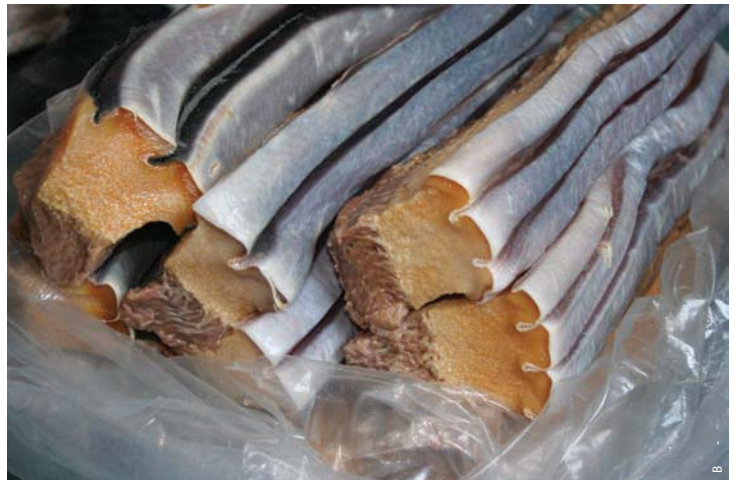
2008年4月16日 左上の軟須の黒くなった溝の部分には白い塩が詰まっているのが確認できる

当初は、箱の中身を調べた後に、その箱を西濃運輸の配送所に戻す予定だったが、この箱の中身が重大な横領行為の証拠であると判断し、このダンボールを確保することに決めた。その後、市場での調査などを行なった上で、この箱を証拠として検察に提出し、共同船舶株式会社社員による横領として告発することにした。