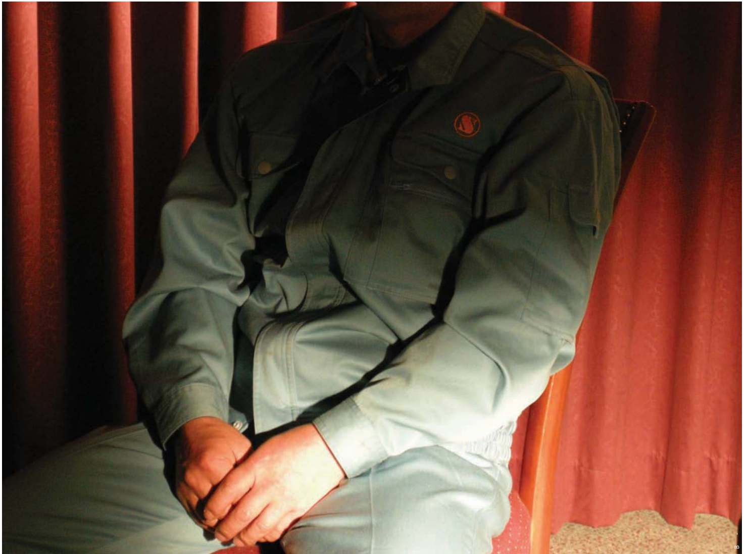
2008年5月 情報提供者のインタビュー、共同船舶のユニフォームを着て