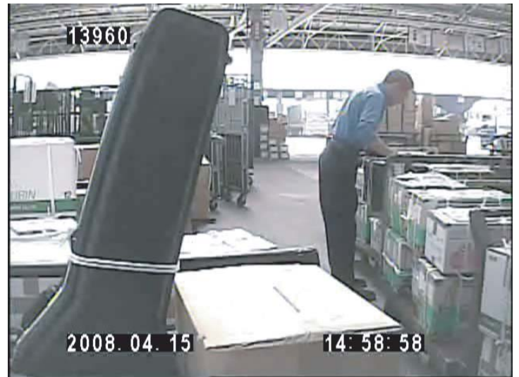
2008年4月15日 西濃運輸の配送所でギターなどの私物と混じって詰まれる箱