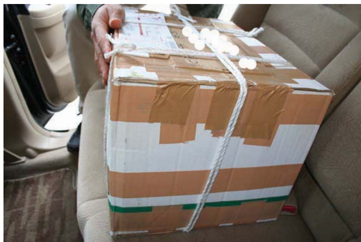
2008年4月16日 青森市内の西濃運輸配送所から箱を一つ確保

この配送所において、品名がダンボールと書かれているにも関わらず、明らかに重い箱を発見。送り主も職員名簿に記載されている「製造手」の一人であることを確認できたため、この箱の中身を市内のホテルで確認することにした。