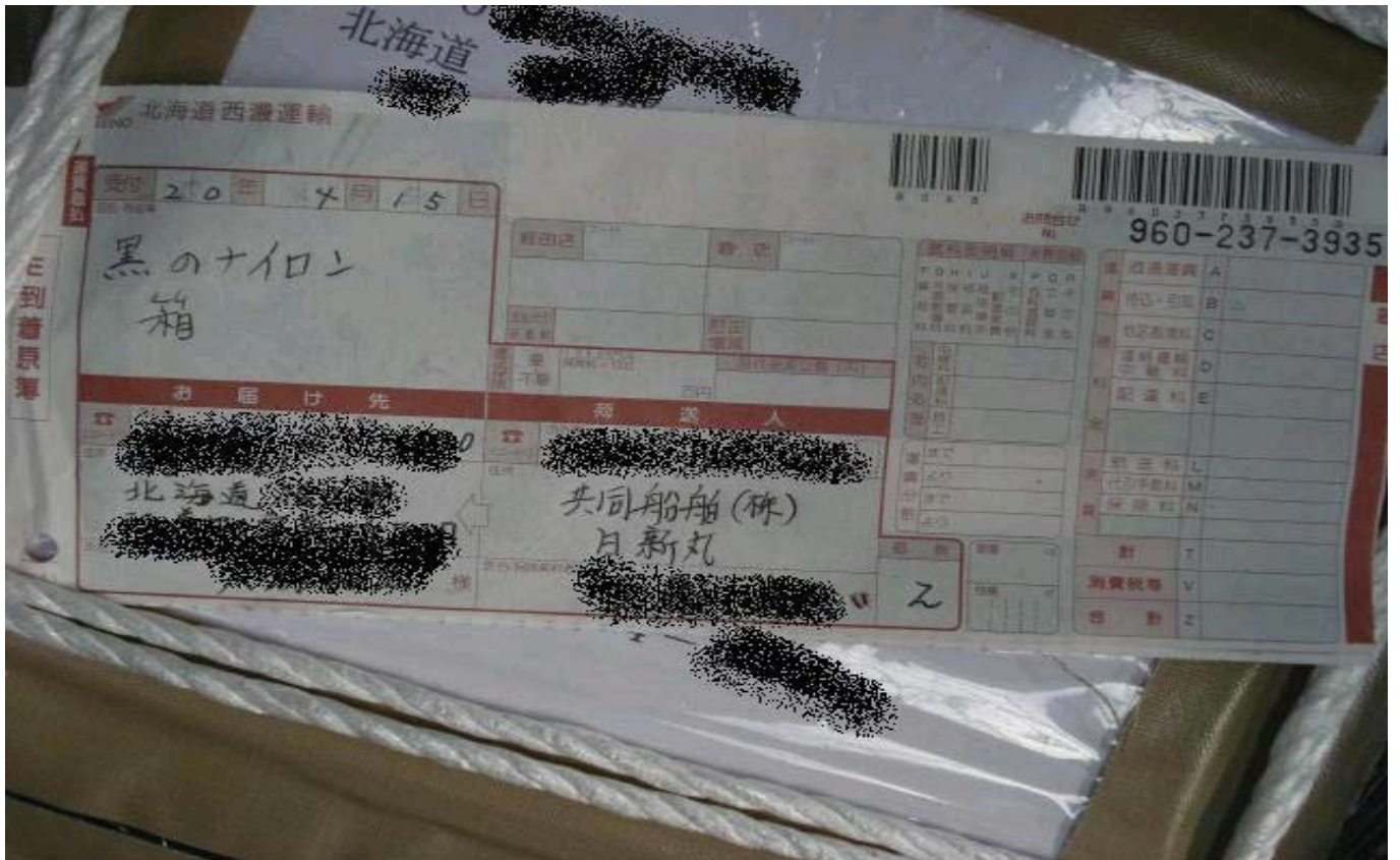
2008年4月15日 北海道宛のこの伝票の品名欄には「黒のナイロン 箱」、 送り主に「共同船舶(株) 日新丸 <本人名>」と書かれている