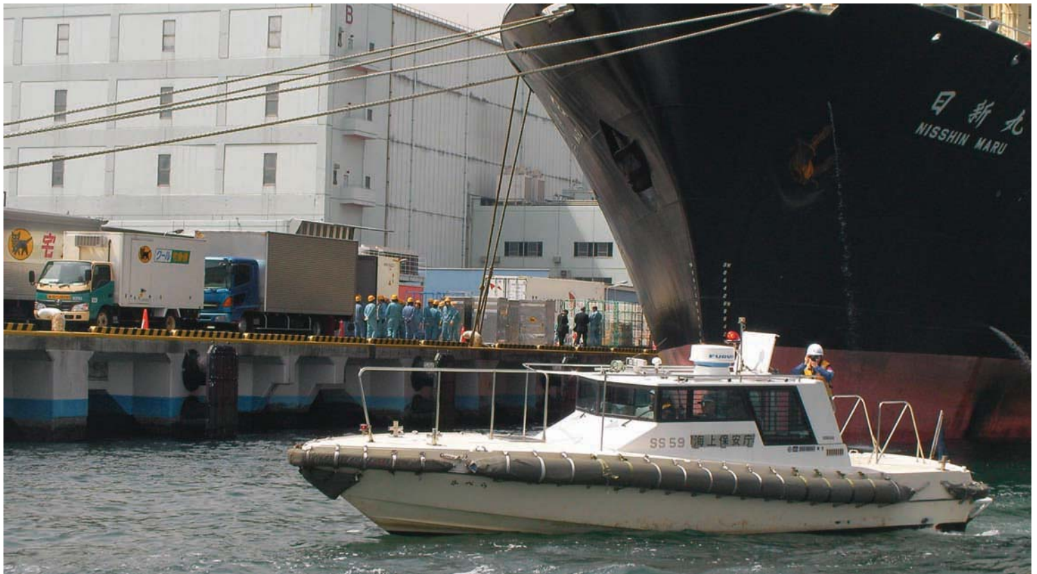
2008年4月15日 東京港大井水産ふ頭に着岸した捕鯨母船・日新丸。岸には船員が集まっているのが見える。手前は海上保安庁の警備船。また岸にはヤマト運輸のクール宅急便のトラックもあり、日新丸から降ろされた“私物”とみられる荷物を受取っていた。

その後、日新丸に設置されているクレーンで合計90箱程度の個人の荷物と思われる箱が岸に下ろされ、岸で待っていた船員がそれらの箱をバケツリレーのようにして西濃運輸のトラックに積んだ。この光景は、2006年の金沢港での光景と酷似していた。その後、調査チームは西濃運輸のトラックを陸路で追跡した。