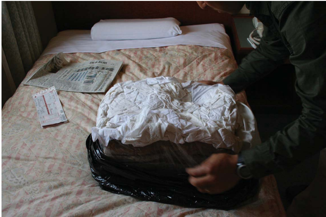
2008年4月16日 作業服で上部を隠すようにして梱包されていた箱の中身 下の黒いビニール袋の中に鯨肉が入っていた