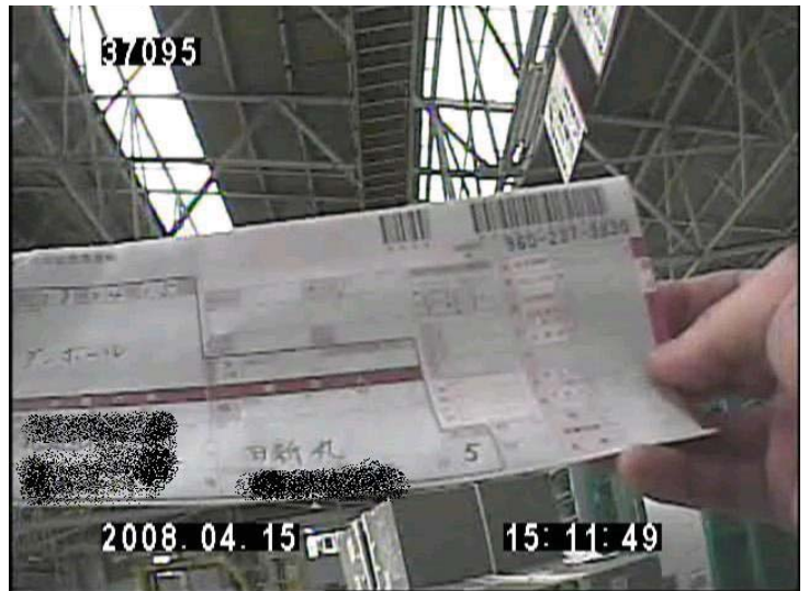
2008年4月15日 この北海道宛の伝票の品名欄には「ダンボール」と書かれ、更に同じ送り先に5箱送られたことを示している