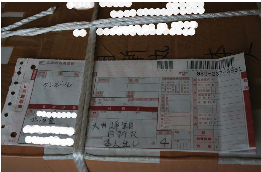
2008年4月16日 箱につけられていた伝票。品名には「ダンボール」とあり、 合計4箱送っていることが示されている