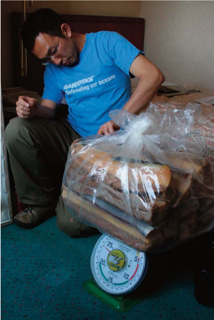
2008年4月16日 箱に入っていた鯨肉の総重量は23.5キロ