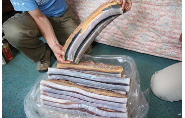
2008年4月16日 出てきた鯨肉は軟須(うねす)と呼ばれる部位で、塩蔵されていたため表面がオレンジ色に変色していた