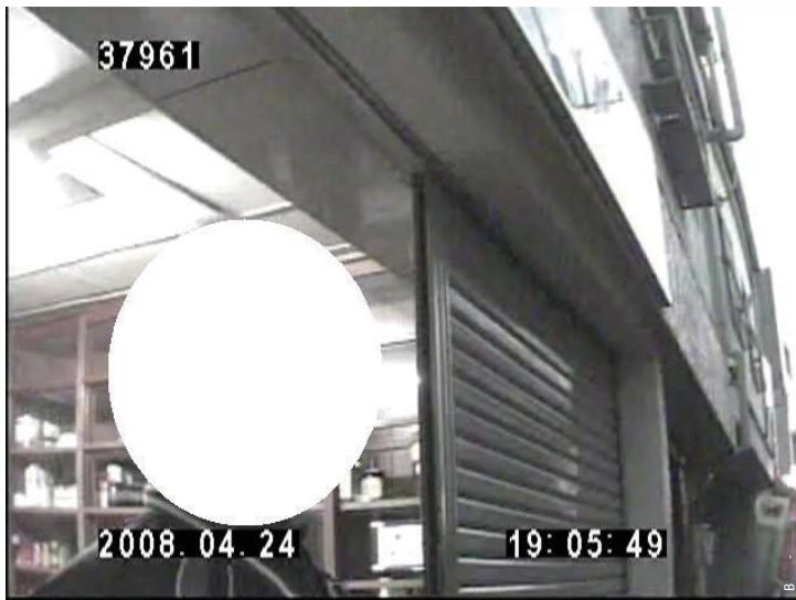
2008年4月24日 広島県で共同船舶に食品や塩などを納入している業者の男性