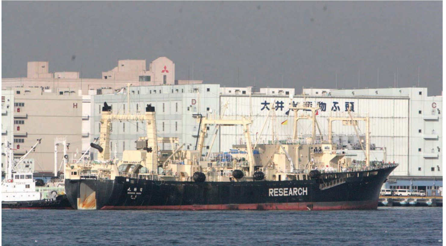
2008年4月15日 東京港大井水産ふ頭に入港した捕鯨母船・日新丸

2008年4月15日、国際的な非難の中、日本の捕鯨船団が5カ月間に及ぶ南極海への航海を終えて東京港に入港した。この「調査捕鯨」と呼ばれる捕鯨活動は、日本政府が「国際捕鯨取締条約に従い公海上で実施する合法的な活動」とするもの。日本が行う水産関連調査プロジェクトとしては最大規模の事業で、日本市民の税金から年間5億円以上の補助金を投じて過去20年間にわたり合計100億円以上の税金が費やされてきた。