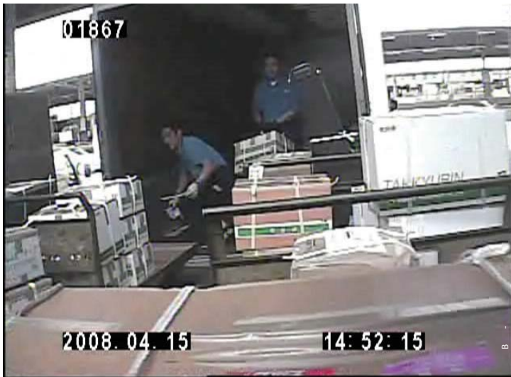
2008年4月15日 西濃運輸の配送所に輸送された個人宛の荷物

西濃運輸で運ばれた箱の送り先と送り主を調べるために、トラックの行き先であった大井水産ふ頭に近い西濃運輸配送所において、それぞれの箱につけられていた伝票を確認した。ここで、確認できた伝票は合計33枚、運ばれた荷物は最低93箱に及ぶ。送り主は確実に名前がわかるだけで、合計23名だった。多くの荷物は、品名が「ダンボール」と記載されており、中には「塩物」と記載されているものもあった。「ダンボール」と記載されているものでも、中身がダンボールとは思えないほど重いものがほとんどだった。これらの箱には、明らかに私物であろうギターなども混じっていた。