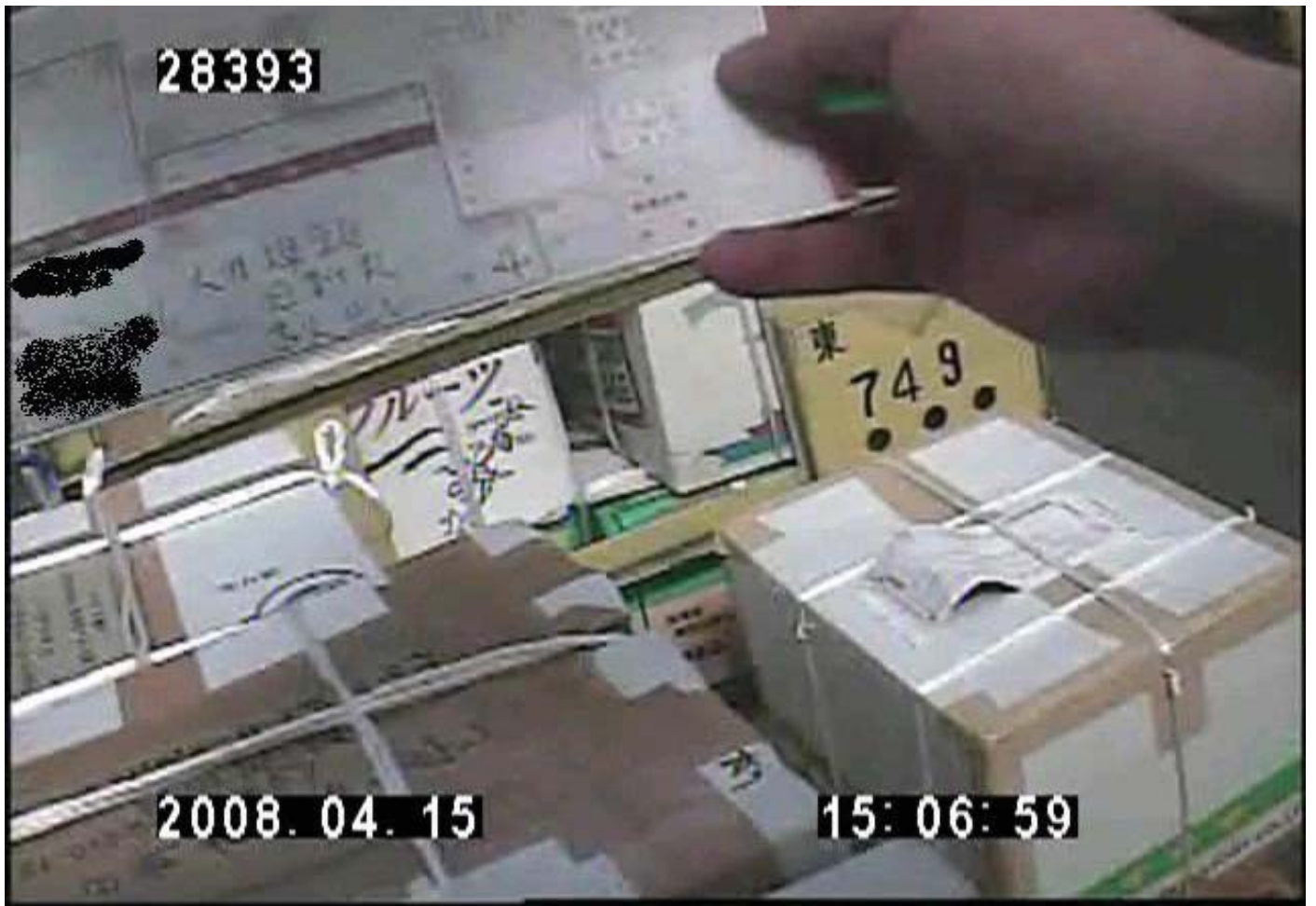
ホテルに持ち帰った箱はその前日に東京で確認した箱のひとつ 前日に東京で撮られた写真中の伝票が今回の青森で獲得した箱につけられていた伝票と一致