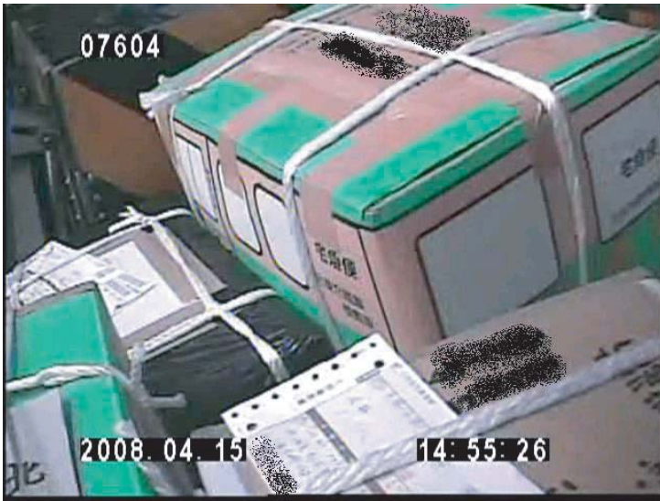
2008年4月15日 日新丸から降ろされた頑丈に包装されている箱が配送所に詰まれる