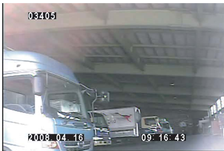
2008年4月16日 青森市内にある西濃運輸配送所へ

翌日、西濃運輸のウェブサイトにて伝票番号を打ち込み配達状況を確認すると、その日の朝のうちに青森県の西濃運輸配送所にそれらの荷物が届いている可能性が高いことがわかり、すぐに市内の配送所へと向かった。