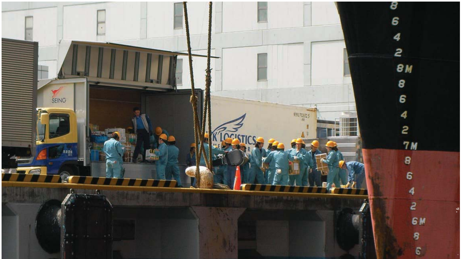
2008年4月15日 捕鯨母船・日新丸から降ろされる荷物を西濃運輸のトラックに積み込む船員たち