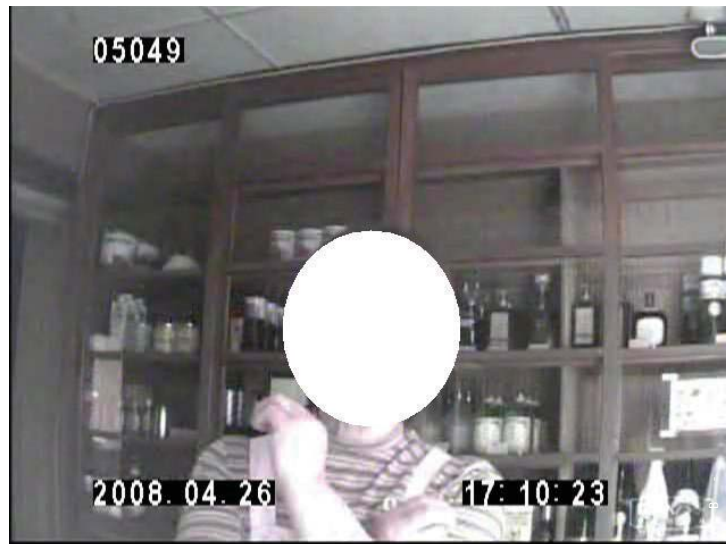
2008年4月26日 広島県で共同船舶に食品や塩などを納入している業者の女性