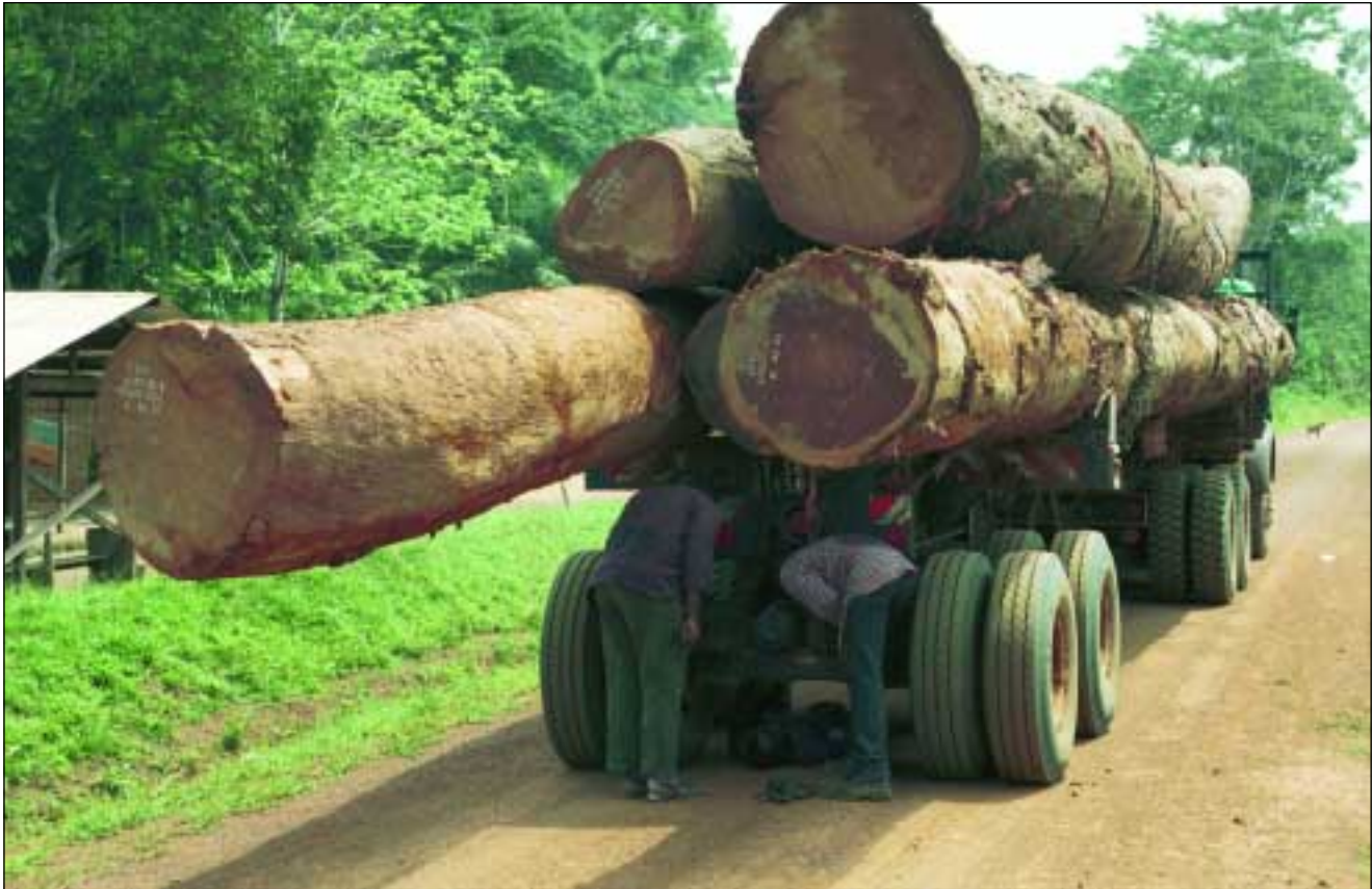
Hout van Wijma op de weg naar de houtzagerij