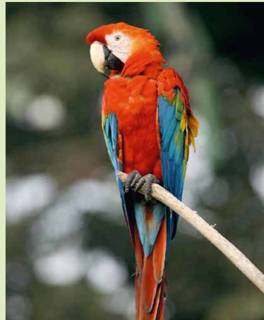
Een scharlaken ara geniet van de Amazonezon.

Greenpeace volgde voor het rapport het spoor van illegale Amazonesoja, van het regenwoud via Braziliaanse havens naar Europa en Nederland. We gebruikten satellietbeelden, vlogen in een klein vliegtuigje over het regenwoud en bestudeerden rechtbankverslagen en belastingpapieren. We vroegen sojaverwerkers en veevoerproducenten naar de herkomst van hun soja en namen vlees- en zuivelverwerkers, supermarkten en fastfoodketens onder de loep. Zo brachten we de hele vernietigingsketen in kaart, van de ontboste Amazone tot de kipkluijjes van McDonald's en de rookworsten van de Hema. We kwamen tot de onontkoombare conclusie: Europese bedrijven zijn medeverantwoordelijk voor de verwoesting van het Amazonewoud.