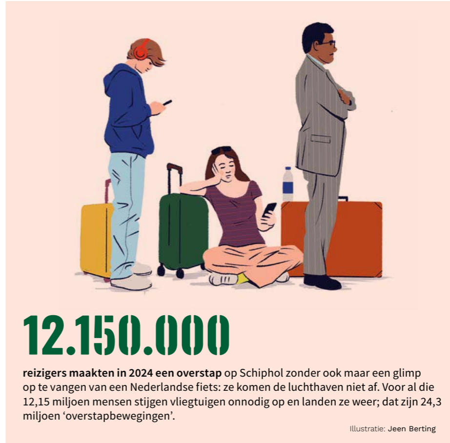
Illustratie: Jeen Berting

Noordzeevelden:  | ¡Olé, oceaan!:  | Plasticimport: