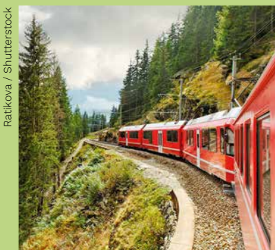
Onderweg van Italië naar Zwitserland.

De luchtvaart moet krimpen om onze planeet te sparen. Gelukkig opent dit de deur naar een herontdekte manier van reizen: slow travel .