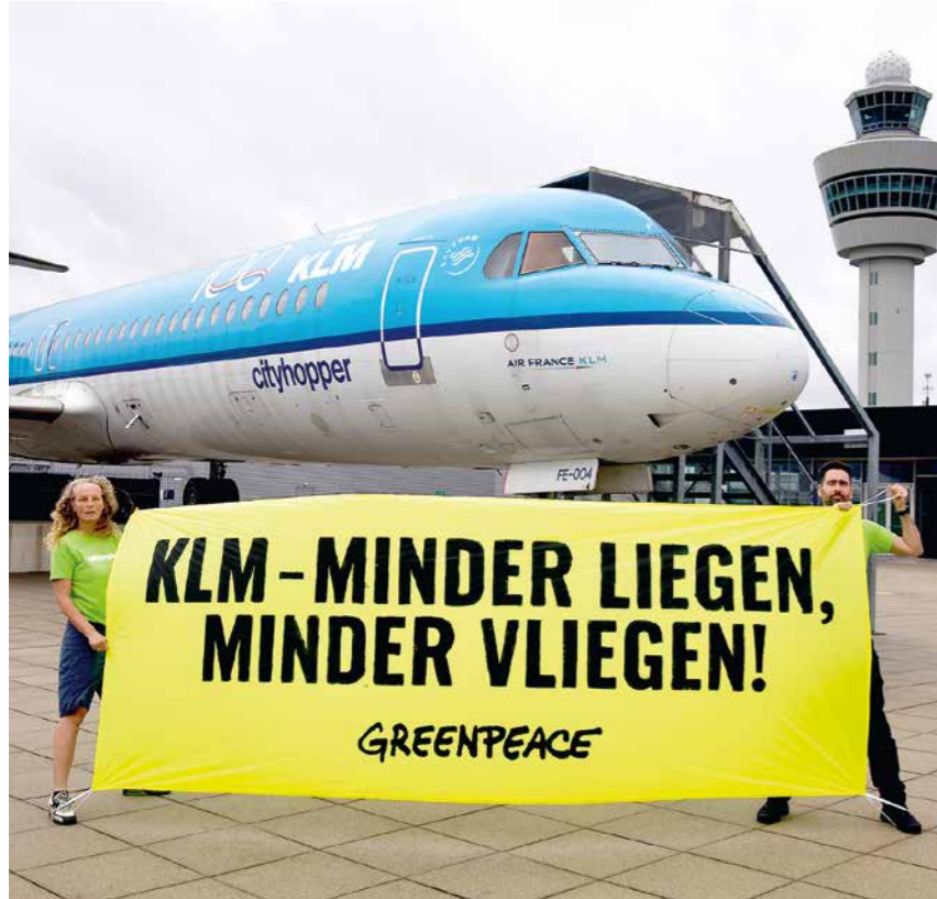
Actievoerders maken begin oktober onze boodschap zichtbaar op Schiphol.