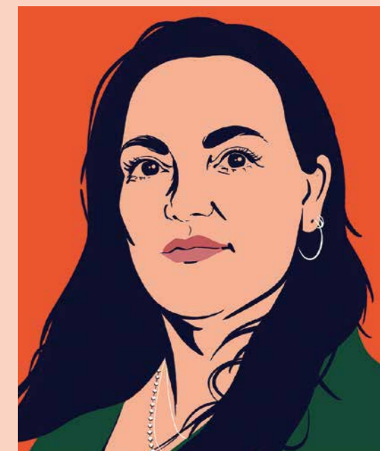
Illustratie: Jeen Berting

„ Als er één ding is dat de geschiedenis ons leert, is het dit: protest werkt.