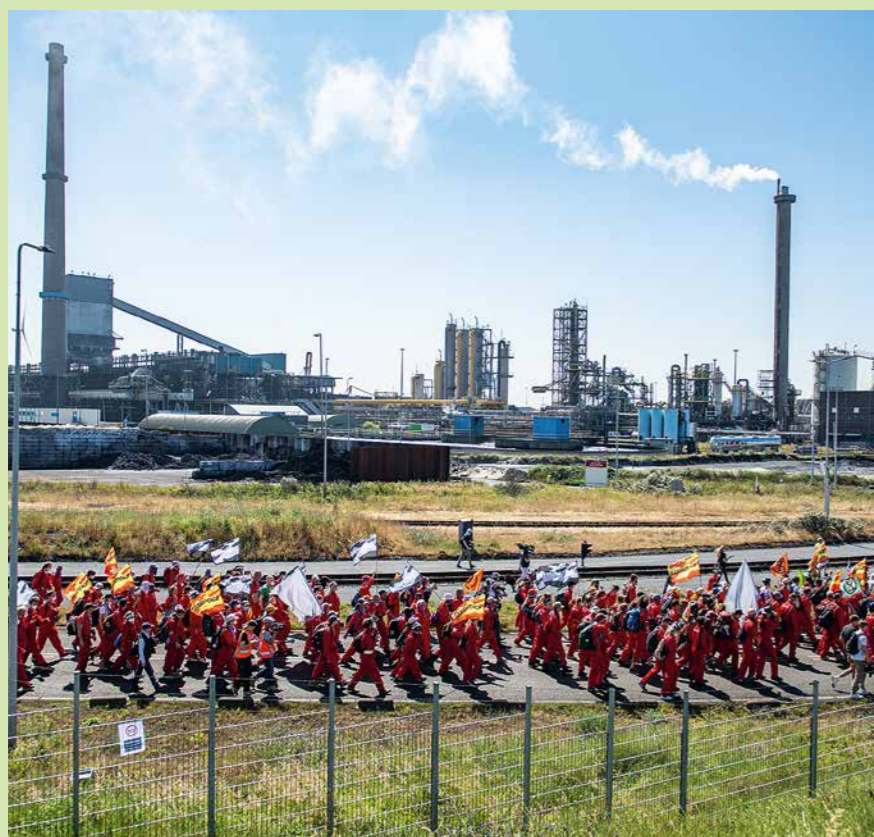
Actievoerders op het terrein van Tata Steel tijdens onze massa-actie in juni 2023.