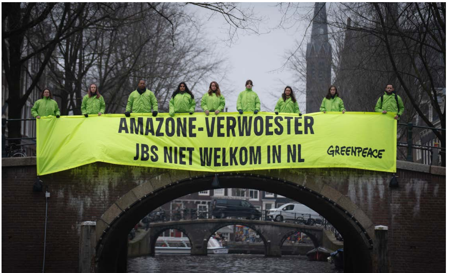
Greenpeace Nederland protesteert tegen de verhuizing van JBS naar Nederland, 2025. Nederland zou geen veilige haven moeten zijn voor bedrijven die hun groei financieren ten koste van de planeet.

Het bedrijf is al jaren berucht vanwege zijn controversiële praktijken. In het dossier ' Cooking the Planet ' van Greenpeace Brazilië 11 staan talloze voorbeelden waarin JBS in verband wordt gebracht met ontbossing, uitstoot van broeikasgassen, mensenrechtenschendingen en corruptie.