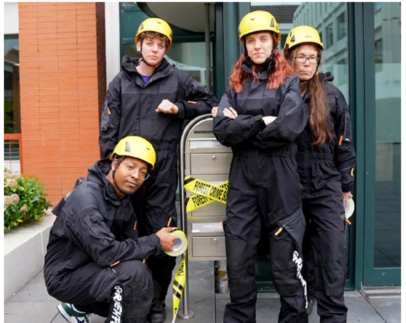
Greenpeace Nederland plakt symbolisch de brievenbus af van JBS N.V. in Amstelveen, april 2025