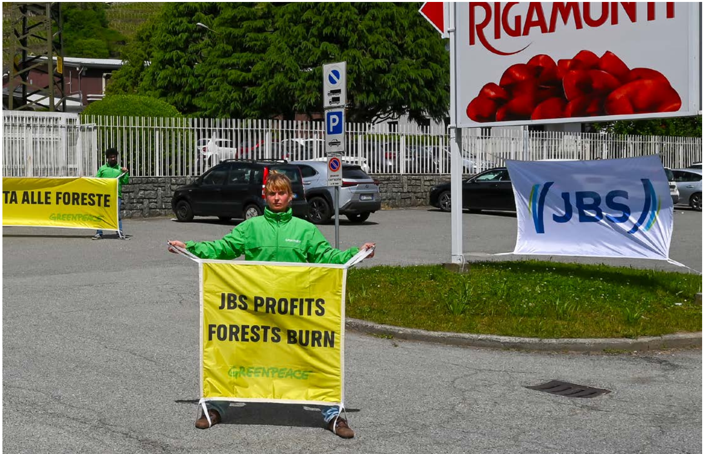
Greenpeace voert actie bij dochterbedrijf van JBS in Italië, 2025