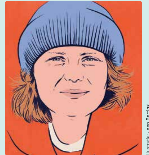
Illustratie: Jeen Berting

Ik stond op het dek van de Witness , zo dik ingepakt tegen de ijskoude wind dat ik verdacht veel weg had van een Teletubby. We waren dagen verwijderd van het vasteland, midden op de Noorse Zee, en voeren langzaam zigzaggend over de Mid-Atlantische Rug op weg naar Spitsbergen. Plotseling kraakte de radio: onze hydrofoon had een potvis gedetecteerd! Ik richtte mijn verrekijker op de staalgrijze horizon en speurde de witte schuimkoppen af. Gelukkig was ik niet de enige die op de uitkijk stond. Naast me stond Oscar, een van onze briljante vrijwilligers met uitgebreide ervaring in het spotten van walvissen bij Andøya. Hij was degene die hem als eerste zag: de onmiskenbare vreemd-schuine spuitstraal van een potvis. Het was mijn eerste ontmoeting met dit reusachtige, intelligente dier – en er zouden nog vele volgen tijdens onze expeditie.