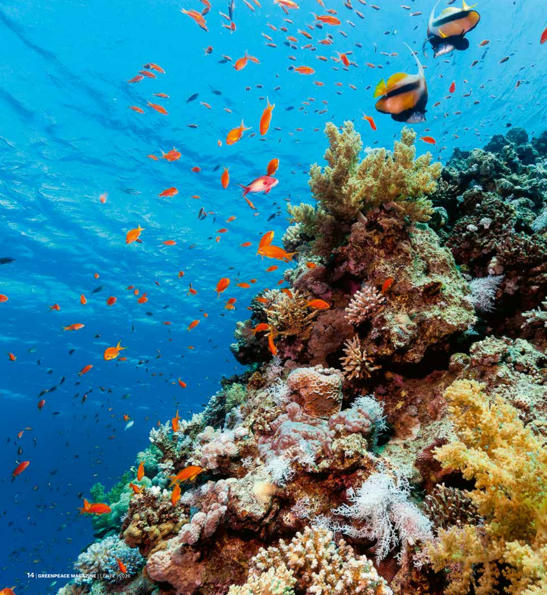
← Kleurrijke vissen en koralen bij een ondiep rif in de Rode Zee

VN-lidstaten op een nieuw verdrag te sluiten voor bescherming van de mariene biodiversiteit en de instelling van beschermde zeegebieden op de volle zee. In de ruim twintig jaren daarna bleven we die boodschap herhalen, in wetenschappelijke expedities en acties op zee, in vergaderzalen, rapporten en grote publiciteitscampagnes: de oceanen hebben een wereldwijd netwerk nodig van zee-reservaten en strikt beschermde gebieden.