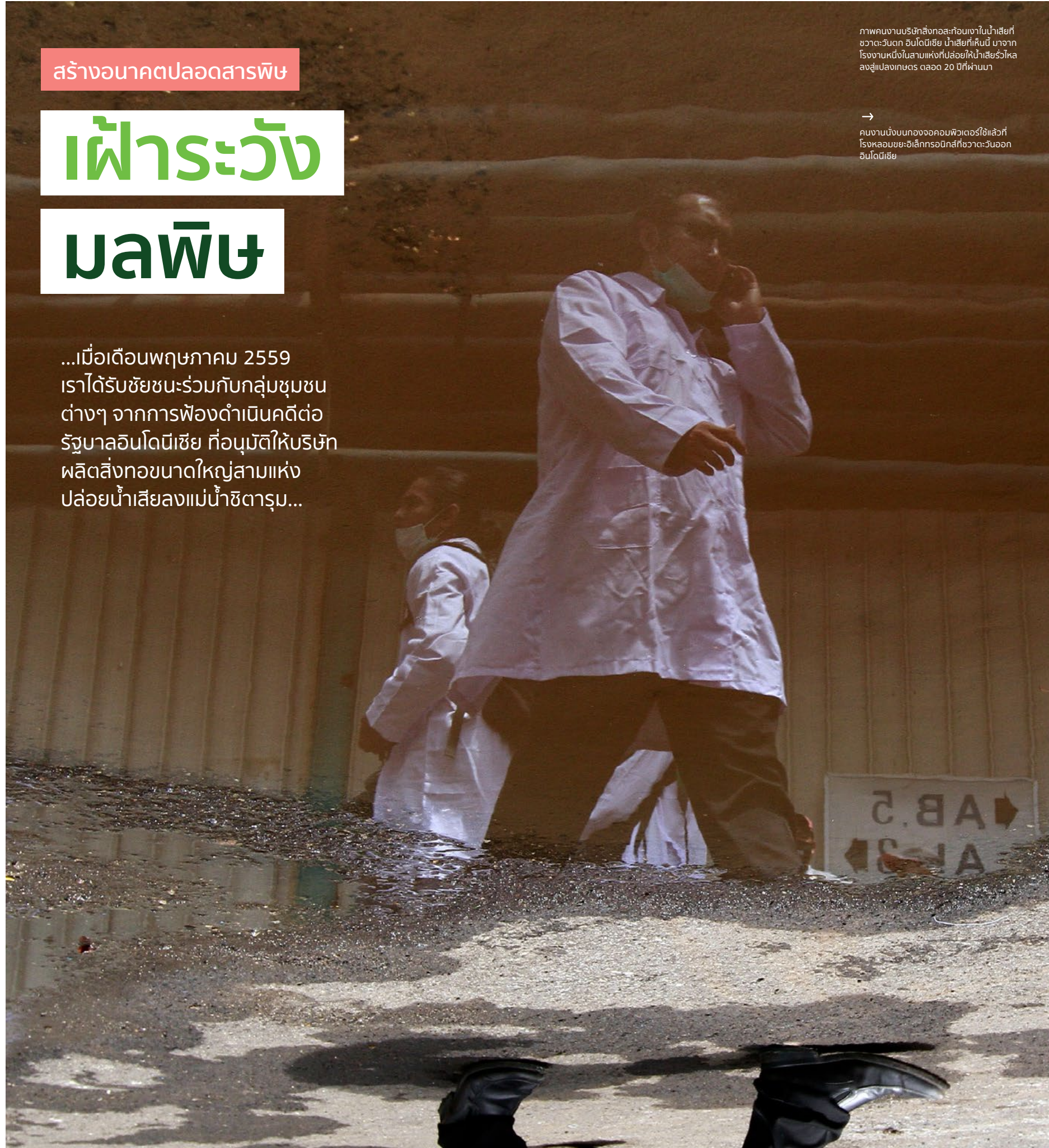
→ คนงานนั่งบนกองจอคอมพิวเตอร์ใช้แล้วที่โรงหลอมขยะอิเล็กทรอนิกส์ที่ชาวตะวันตกอินโดนีเซีย